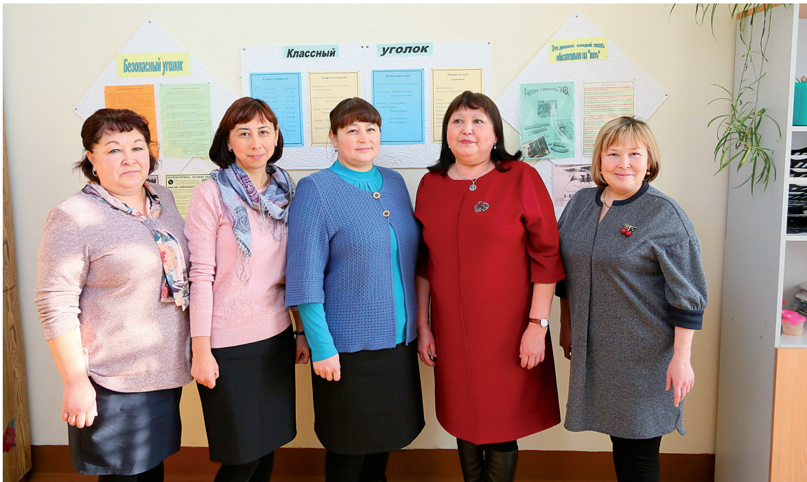
В их руках – будущее деревни