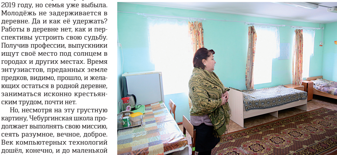
В комнате девочек уютно и тепло

С гордостью заведующая говорит о своих коллегах, называя их многостаночниками. Каждый из них ведёт несколько предметов, при этом успевая заниматься внеклассной и кружковой деятельностью