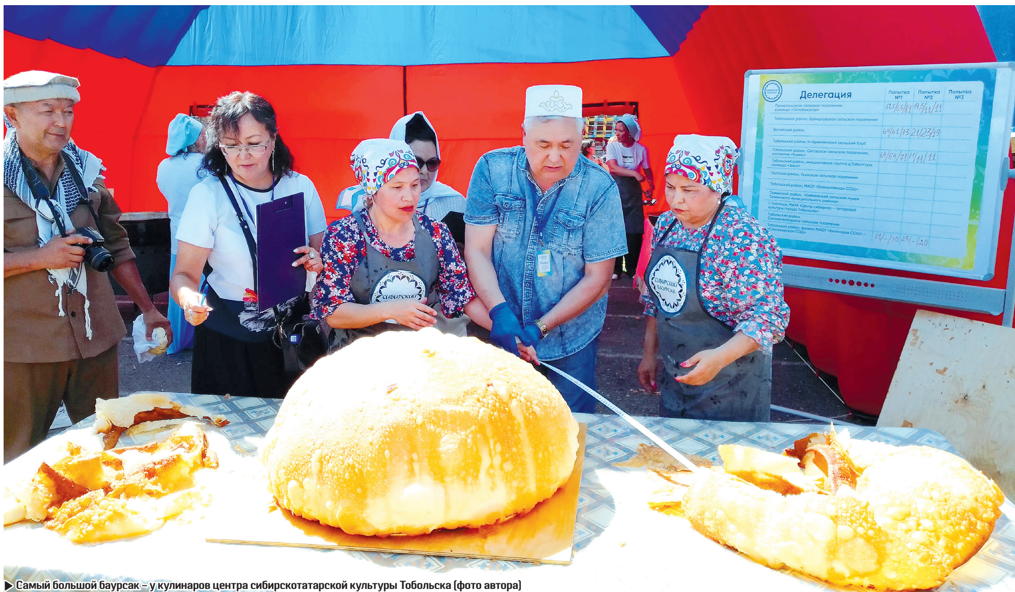
► Самый большой баурсак – у кулинаров центра сибирскотатарской культуры Тобольска