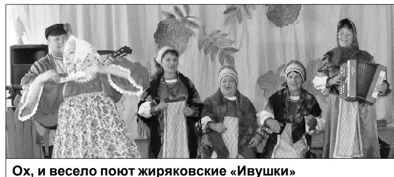
Ох, и весело поют жиряковские «Ивушки»