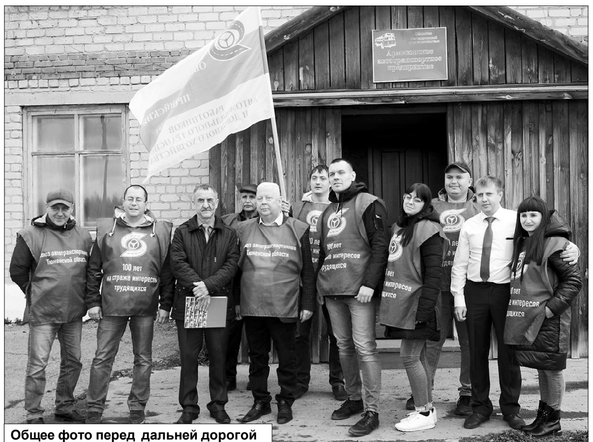
Общее фото перед дальней дорогой