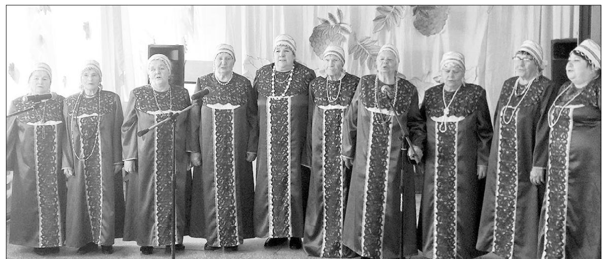
Юбилейное выступление фольклорной группы «Вечерние зори»