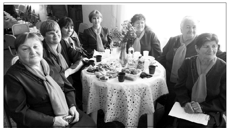
Встреча с песней подарила прекрасное настроение прохоровским «сударушкам»