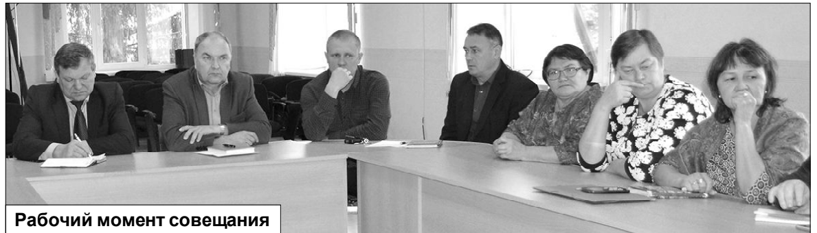
Рабочий момент совещания