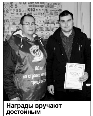
Награды вручают достойным

В целом встреча прошла на позитивной волне, оставив самые приятные впечатления и у