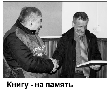
Книгу - на память

Президент Союза автотранспортников и исполнительный директор призвали работников транспорта и дорожного хозяйства к активной жизненной позиции, напомнив, что профсою-