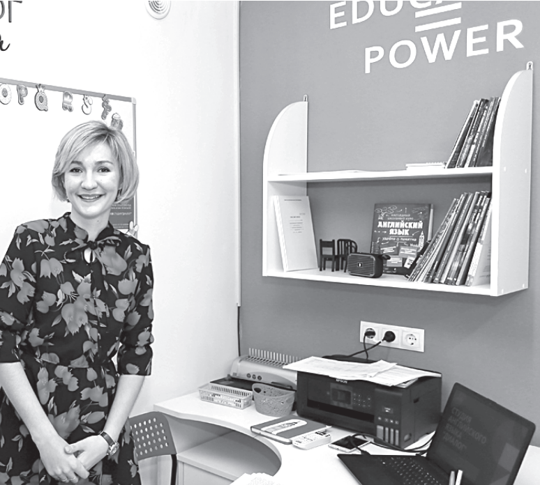
Открытие студии английского языка для детей и взрослых «Диалог»