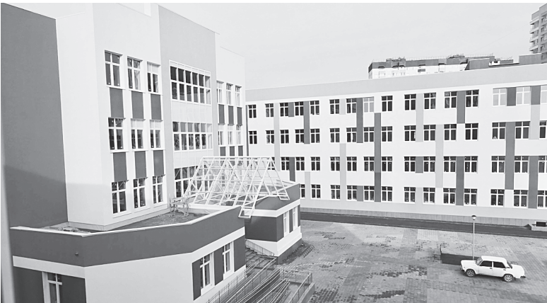
В 2019-м открылась новая школа в 15 мкр.

Говоря о развитии в городе физкультуры и спорта, он за