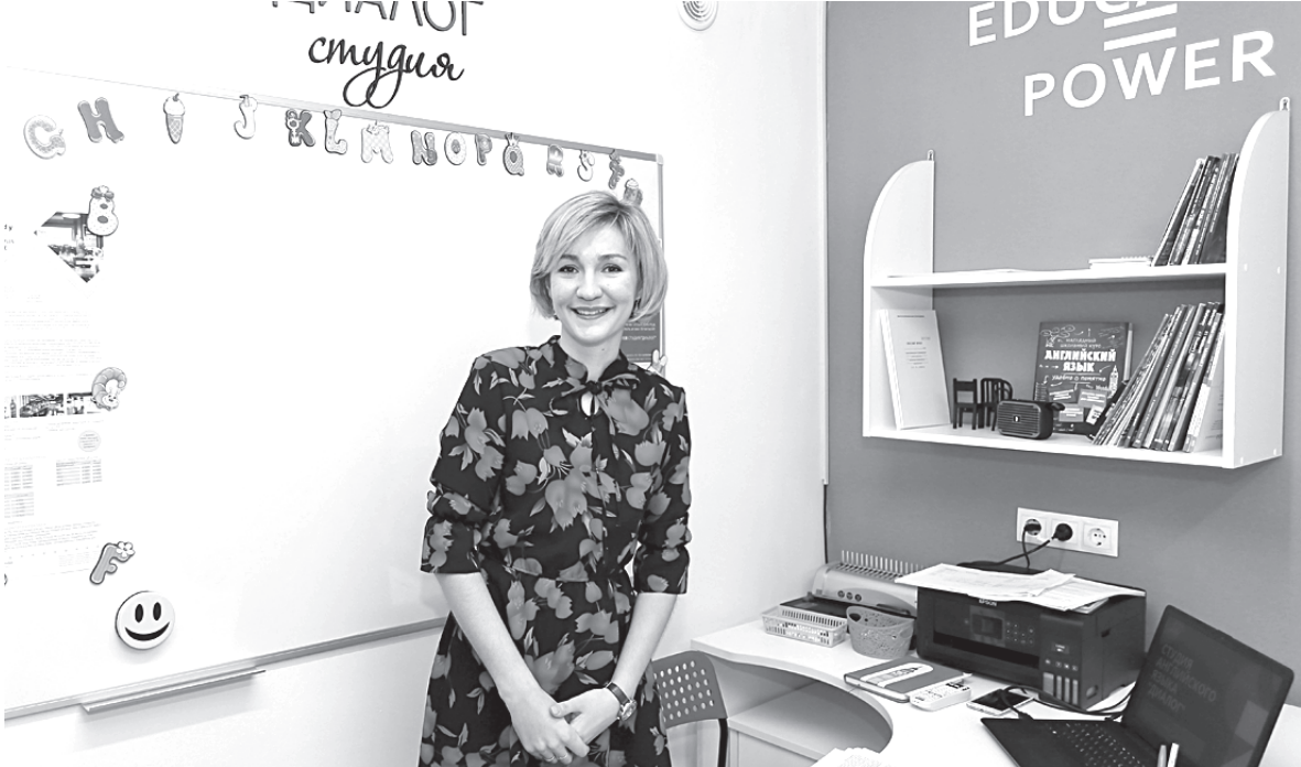
Открытие студии английского языка для детей и взрослых «Диалог»

Он добавил, что ежегодно в школах города увеличивается