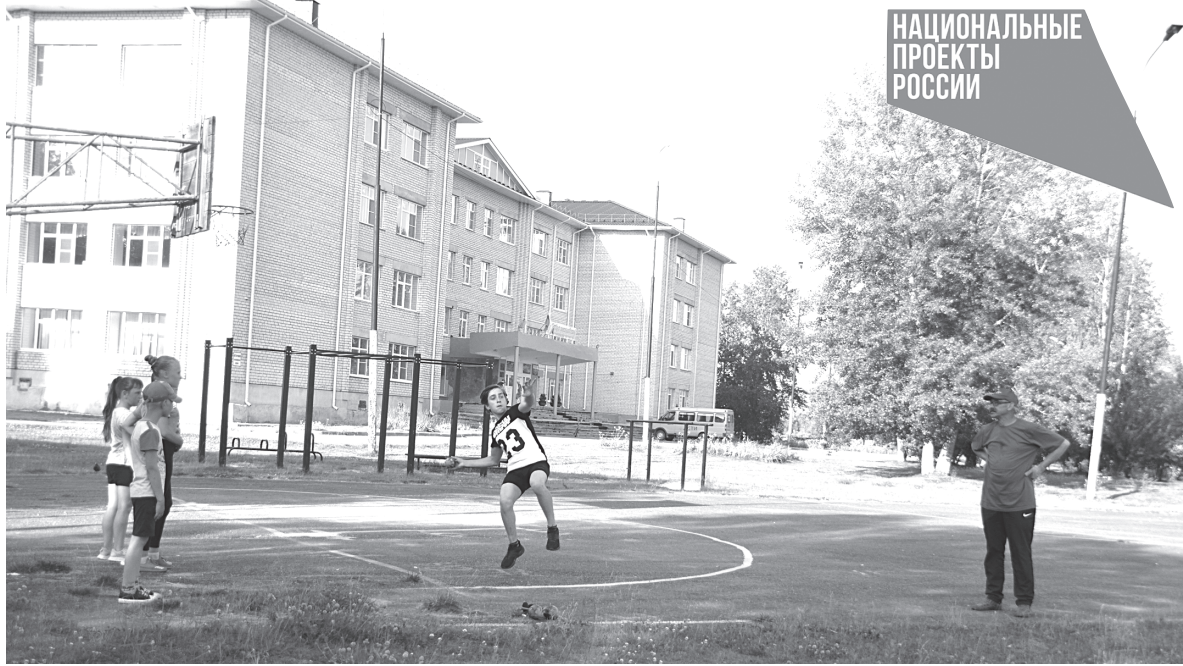
В очередь на метание

Площадка только начала работать, и занимающихся пока немного. Приходят сюда учащие-