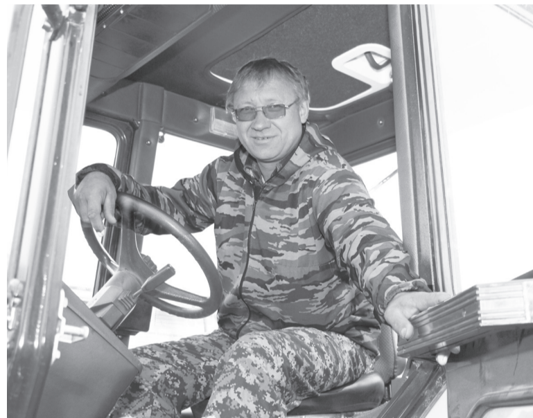
Работник авиабазы любит свою профессию.

Сотрудник Сладковского филиала «Тюменской авиабазы» уже более десяти лет занимается охраной и приумножением лесных богатств