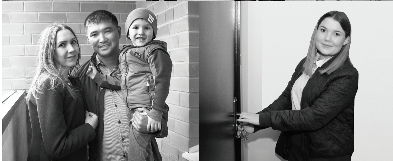
Современные дома решили проблему жилья многих сладковцев и улучшили архитектурный вид села.