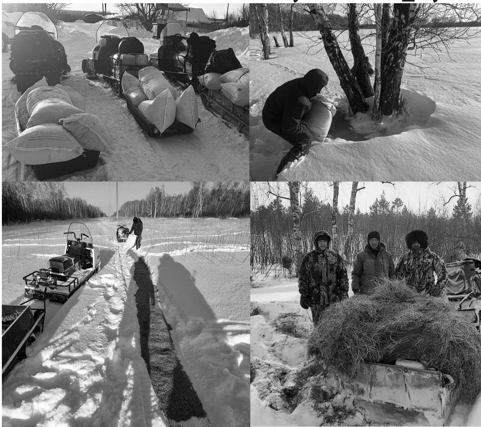
Специалисты сорокинского сектора государственного надзора и контроля и охотники готовят кормовые площадки