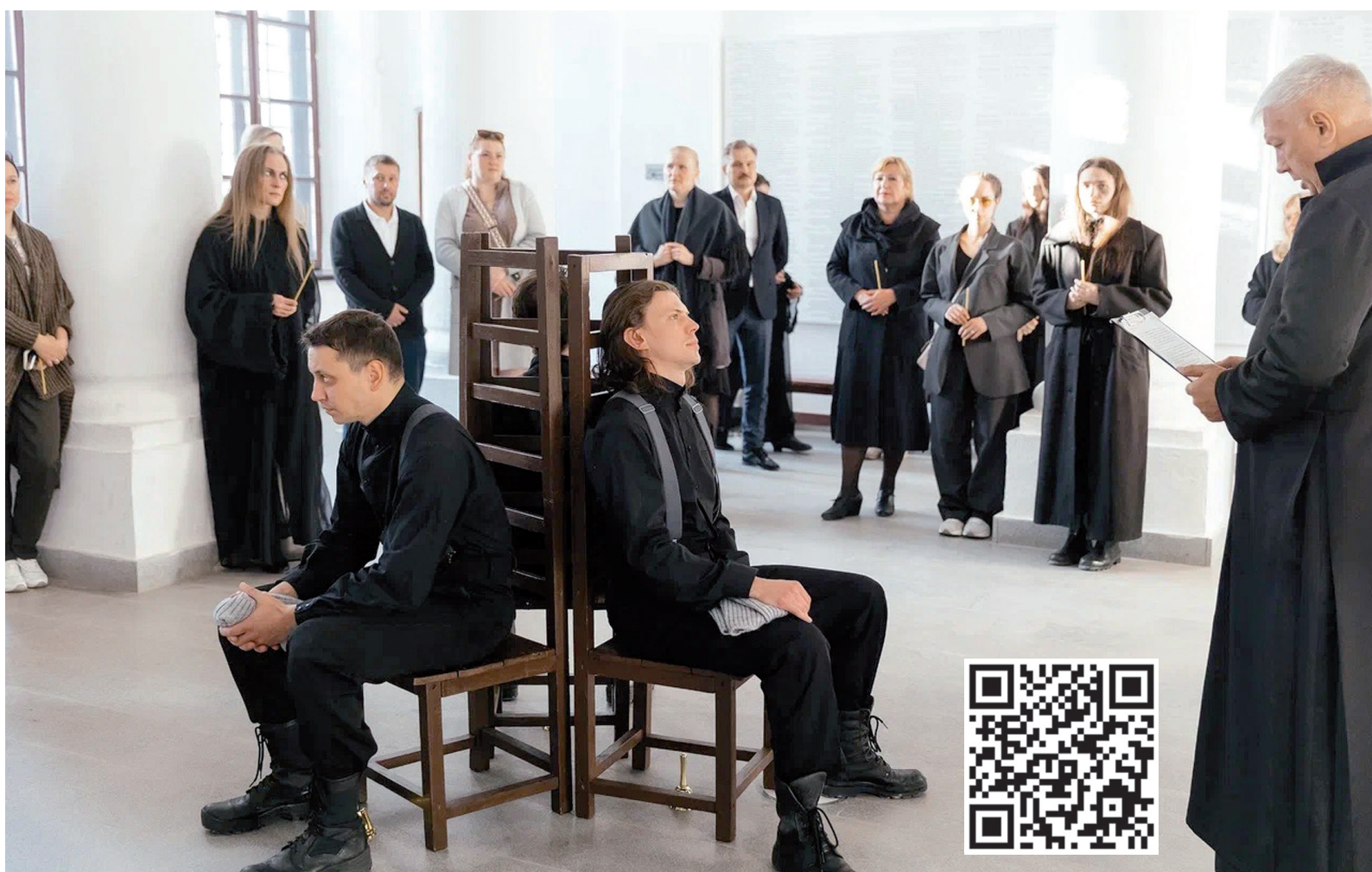
Тобольские актёры и зрители прошли по «Этапам»

В шестой раз Тобольск стал площадкой большого театрального праздника: в последнюю декаду июня тобольские зрители смогли увидеть пять удивительных спектаклей