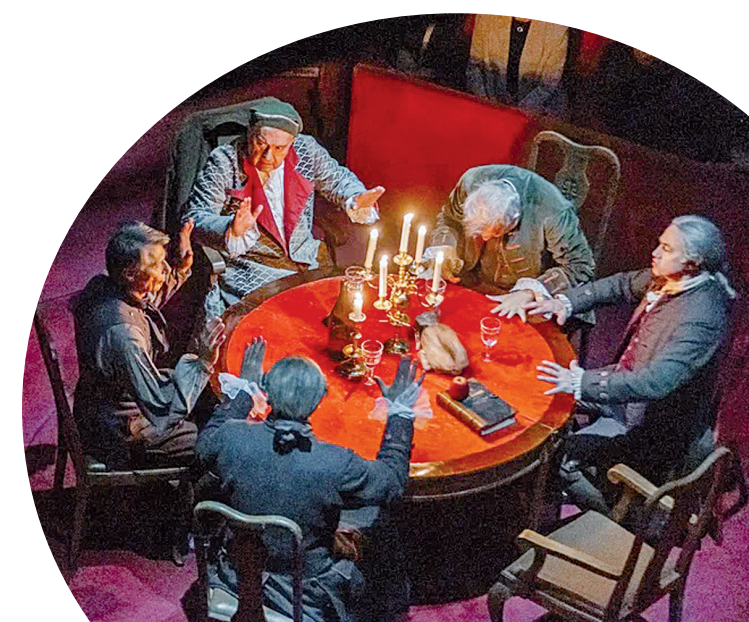
плавно переходящий в ужин

Оказалось, что на большой сцене поставят бархатный шестигранник, одновременно похожий на аудиторию для лекций и на объект эзотерической геометрии