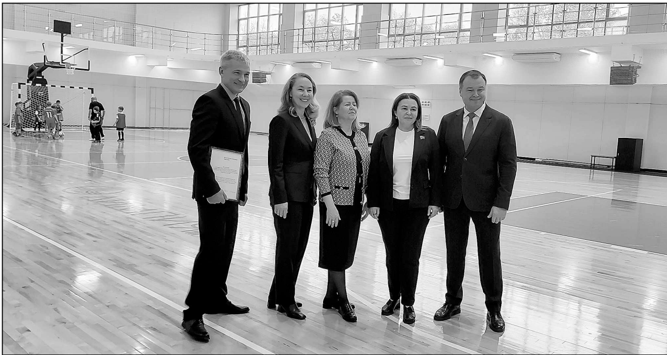
Участники рабочего визита в зале для игровых видов спорта спорткомплекса «Олимпия».