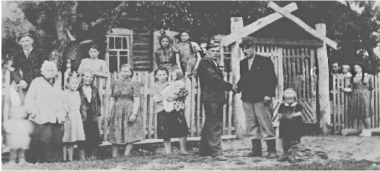
Учителя села Усть-Ламенка с детьми из Ленинграда у школы

Началась блокада 8 сентября 1941-го и длилась почти 900 дней. Это время испытаний в бесконечных бомбёжках, холоде и голоде, охвативших Ленинград.