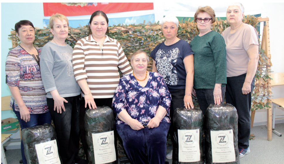
Волонтерский отряд «Мы с вами».