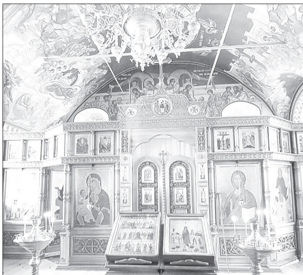
Фестиваль начался с посещения Абалакского мужского монастыря