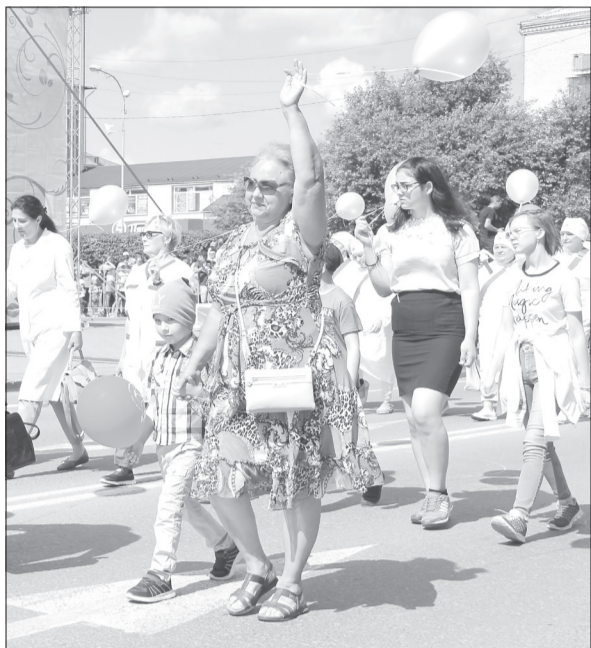
Традиционно День города начнётся с праздничного шествия колонн

Как интересно провести День города и ничего не упустить?