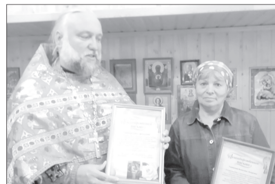
Для верующих главное не награды, а внимание и любовь друг к другу и ближним

Престольный праздник в июне отмечали не только в больших церквях, таких как Сретенский собор с его приделом во имя Святой Живоначальной Троицы, но и в дорогой людям невеликой часовне Старого Кавдыка. Об этом рассказывает староста Татьяна Молодых.