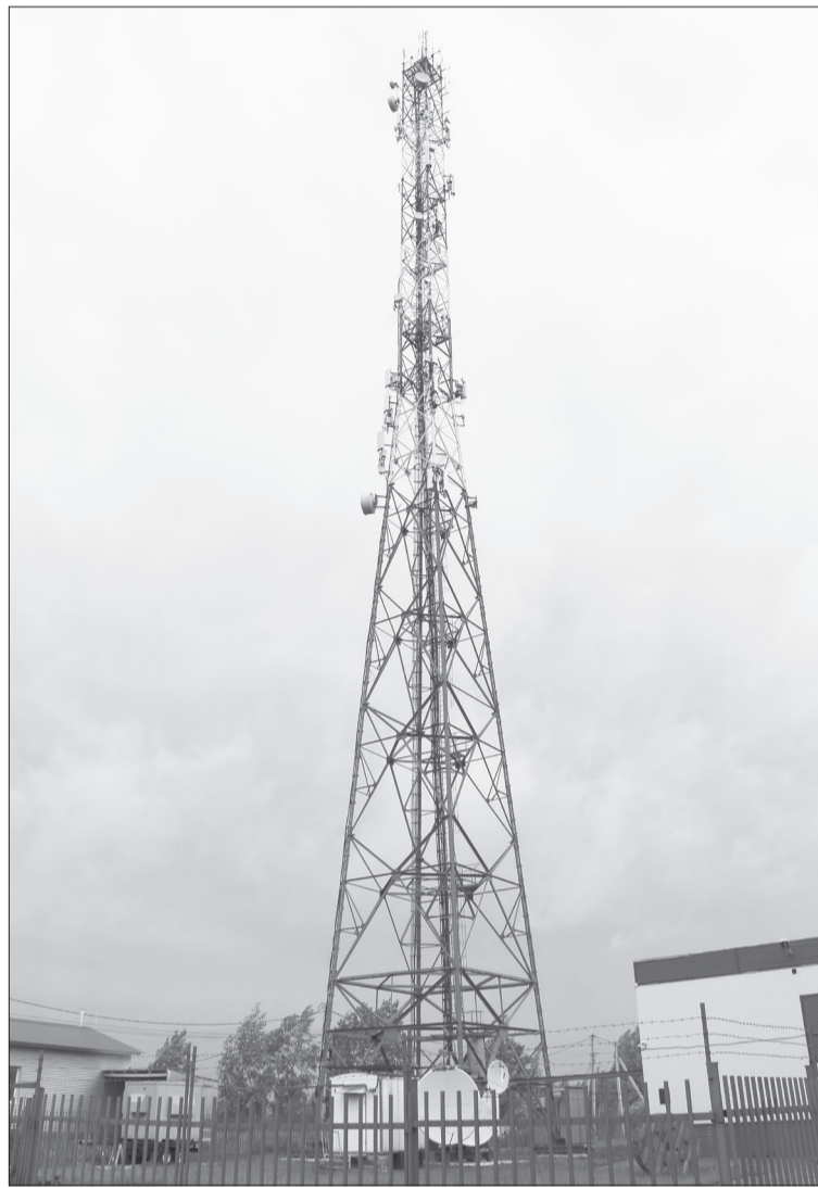
Сигнал «Радио-7» распространяется с вышки на ул. Ишимской

■ О приостановлении вещания «Радио-7» на частоте 71,18 УКВ нужно сообщать по телефону 8 (3452) 49-00-12