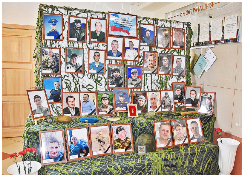
Выставка, посвящённая воинам-землякам, погибшим в зоне СВО

В соревнованиях по мини-футболу первое место заняла команда «Феникс» (с. Казанское), второе место — команда «Молодёжка» (спортивная школа Казанского