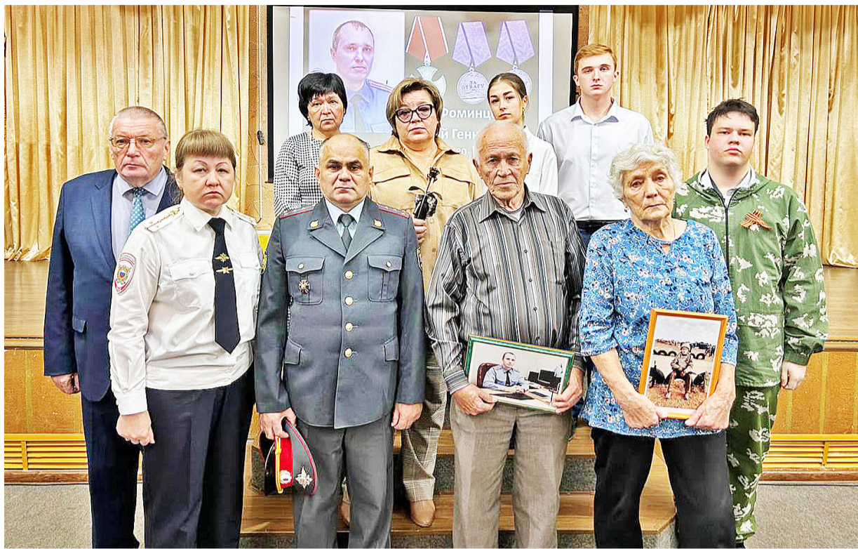
Организаторы и участники урока мужества