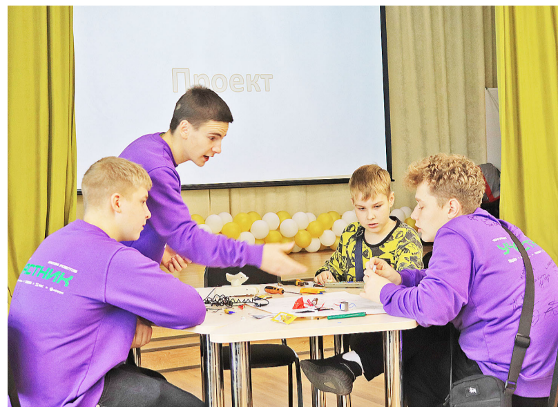
Работая в команде, ребята принимают совместные решения

Юные техники разобрали всё то, что лежало у них на столах. Ребята с интересом рассматривали устройство предметов и размышляли, что можно из этого смастерить.