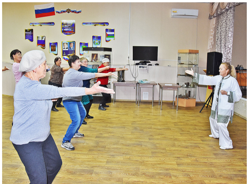
Участники встречи разучили несложные упражнения дыхательной гимнастики цигун

– Таких медвежат мы отправляем вместе с посылками и письмами