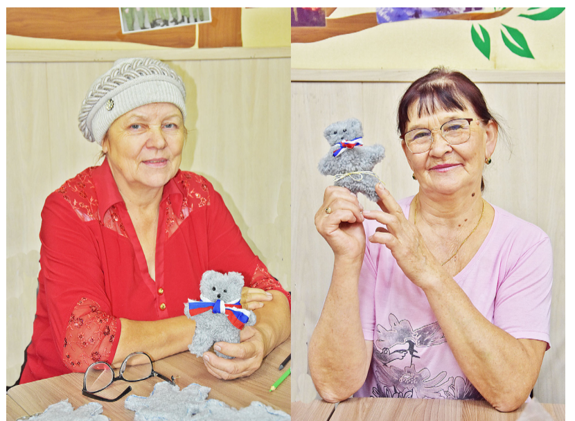
Казанские активистки с удовольствием приняли участие в мастер-классе и сделали на память меховую игрушку