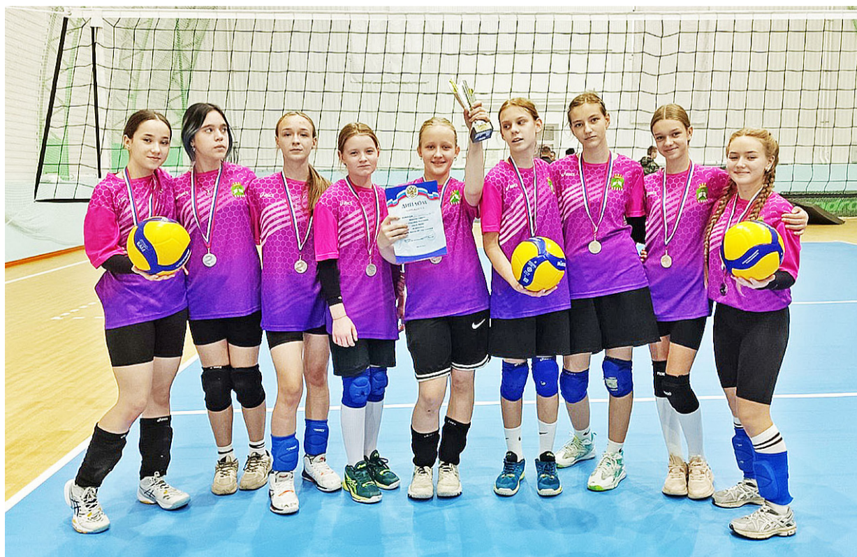
Очередной спортивный трофей в копилке у казанских волейболисток

Андрей СЕРГЕЕВ Фото из архива спортивной школы Казанского района имени Героя России Жумабая Раизова