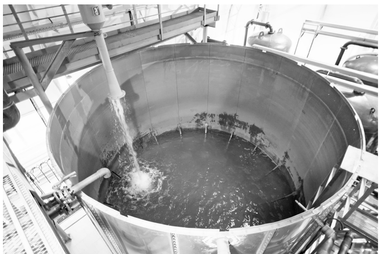
Водоканал работает на полную мощность.

Губернатор обратился к проблеме с чистой водой в пригороде Тюмени. Ситуация стала известна на всю страну после обращения жительницы Каскары в прямом эфире к Президенту России Владимиру Путину.