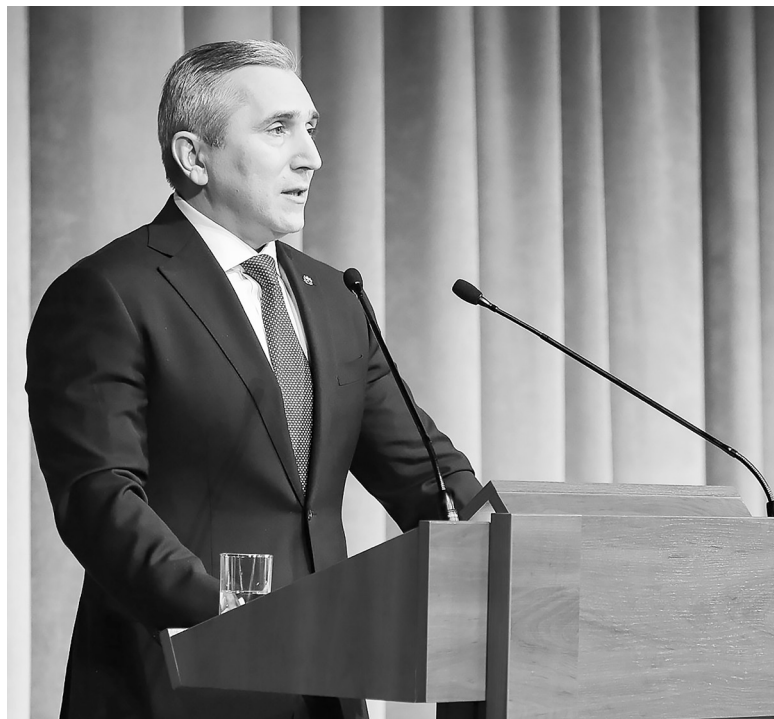
Александр Моор – губернатор Тюменской области.

Губернатор Тюменской области Александр Моор выступил с Посланием к региональному парламенту и жителям области