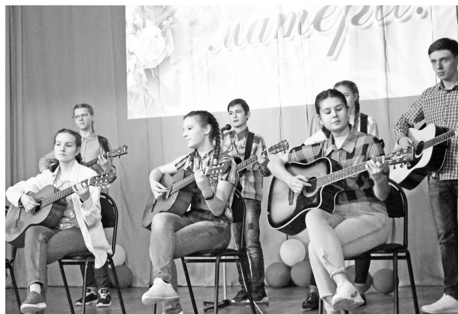
Песня-послание маме в исполнении группы «Санрайз» до слёз растрогало присутствующих на концерте.

В этот день было и несколько дебютов. Младшая группа ложкарей исполнила песню «Маша». Ребята очень старались и получили свою порцию аплодисментов. А участники театрального кружка читали добрые стихи о мамах. Завершающим аккордом концерта стала песня «Слушай сердце своё» в