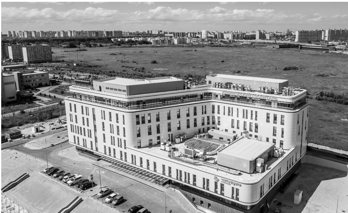
Многопрофильный медицинский центр «Мать и дитя».