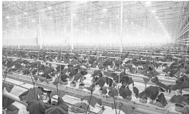
Тепличный бизнес развивается успешно.