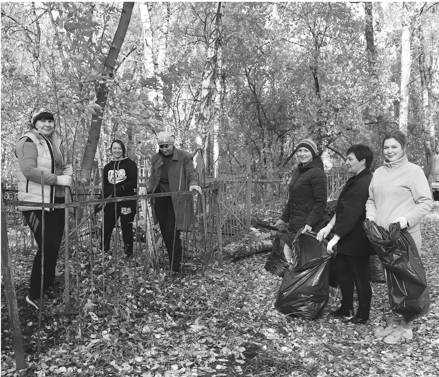
После субботника на кладбище стало чисто