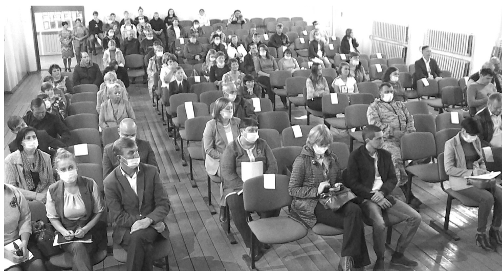
Активные граждане Гладилловской территории не пропускают общественные мероприятия