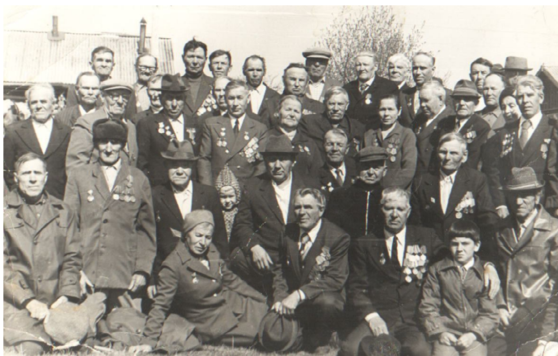
Односельчане помнят воинов-земляков. Снимок 80-х лет