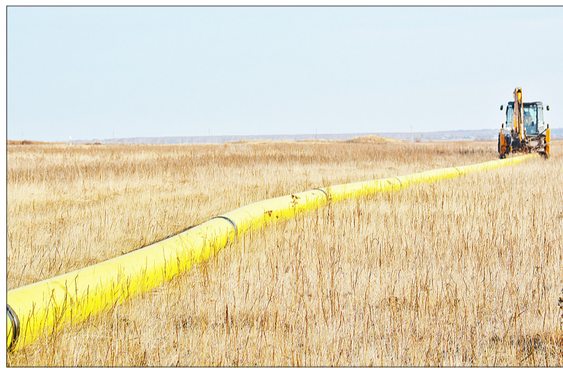
Прокладывается газовая труба большого диаметра

кации, в рамках которой осуществляется строительство межпоселкового газопровода высокого давления до посёлка Новоселёзно с отводом на населённые пункты: деревня Малая Ченчерь – село Большая Ченчерь – посёлок Челюскинцев – деревня Долматово – деревня Щадринка – деревня Дальнетравное – деревня Чирки. Работы по данному проекту должны быть завершены в конце 2022 – начале 2023 года.