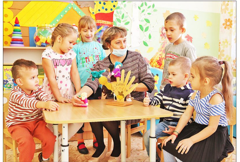
Найти интересные игры для малышей – главная задача воспитателя

Группа жила в обычном режиме: завтрак, прогулки на свежем воздухе, обед, тихий час, полдник. График работы для воспитателей был составлен с учётом их мнения. Посменно заступали на пост воспитатели и нянечки из разных групп. Также на рабочем месте находились повар, медицинская сестра, заведующая и охранники.