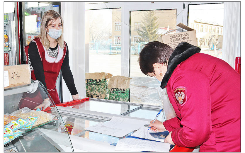
За нарушение требований грозит штраф либо приостановление деятельности торговой точки

На дверях магазинов или возле кассы висят объявления: «Вход без маски запрещён» или «Без масок не обслуживаем». Но многие посетители на это не обращают внимания. Когда требовали надеть маску, одни сразу же это делали, другие