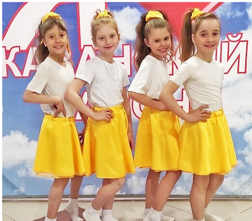
Юные таланты из танцевального кружка «Фантазия»

Как и раньше, культурно-досуговая деятельность является основным направлением сельских клубов. Самая благодарная часть творческого населения – дети, они до сих пор являются основными участниками большинства мероприятий. Ребятня легко откликается на что-то новое, если её заинтересовать. В наш век информационных техно-