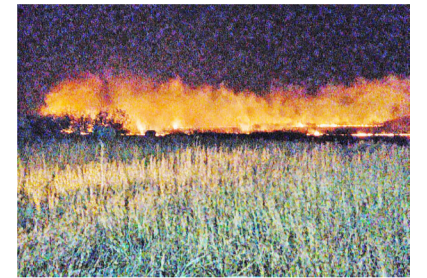
Природные пожары в преддверии зимы – большая редкость

За ноябрьские выходные работники лесного хозяйства неоднократно поднимали по тревоге, причина – многочисленные природные пожары.