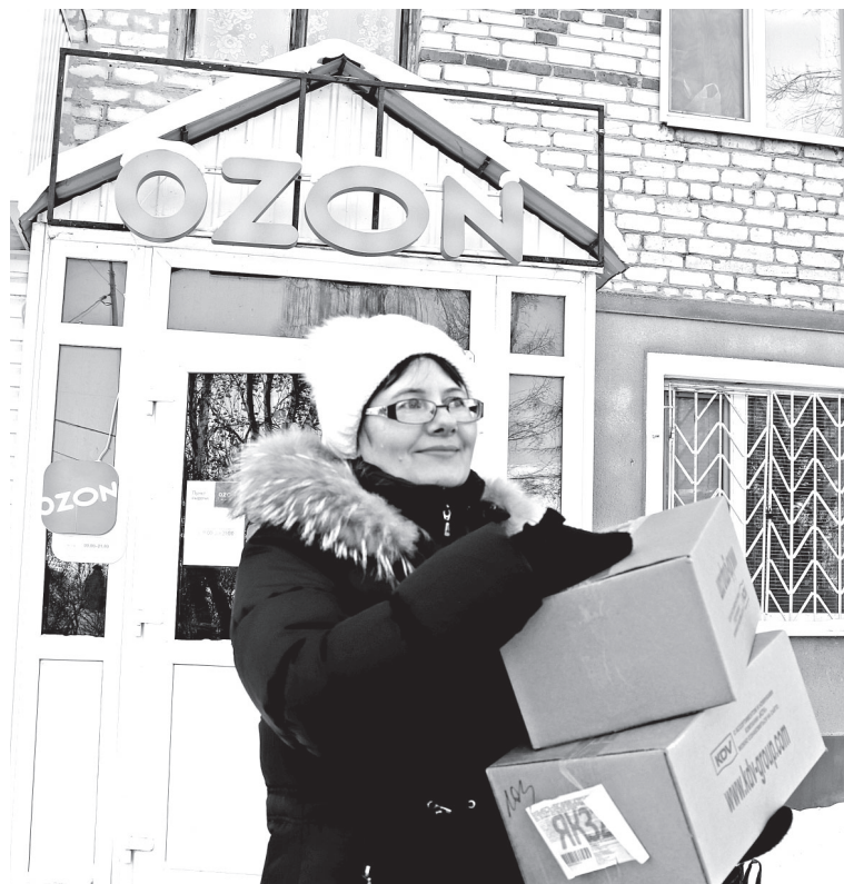
• Пункты выдачи интернет-заказов в Заводоуковске открыты с утра до позднего вечера. Это удобно: товар можно забрать и после рабочей смены.

Сегодня каждая четвертая покупка в России совершается через интернет. Есть мнение, что онлайн-торговля распростирается в период пандемии, ведь приобрести товар из дома как минимум безопасно. Многие заводоуковцы тоже предпочитают «шопиться» в сети.