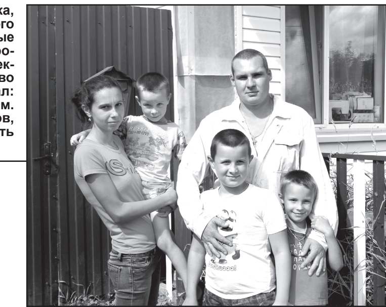
Село для детей – безопасная среда проживания