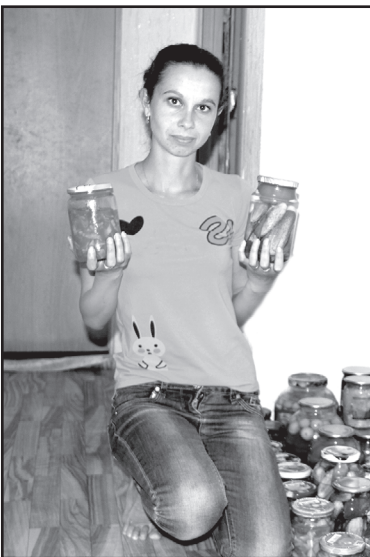
Храним лето в банках