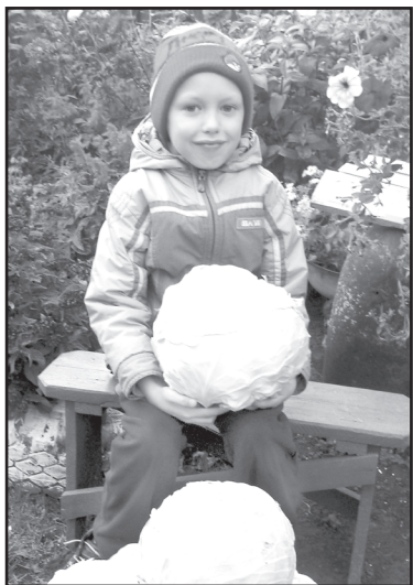
Ох, тяжёл кочанок!