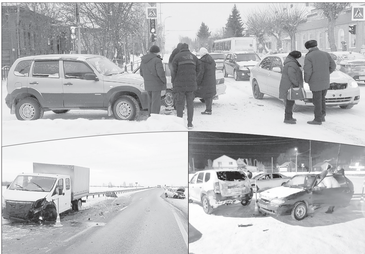
За день в городе и районе произошло пять ДТП

Спустя час, в 13-15, на 68 км федеральной трассы Тюмень - Омск фура с полуприцепом сети магазинов «Магнит» съехала с проезжей части в поле. А в 14 часов на 61 км той же дороги водитель автомобиля Renault Logan не выдержал боковой интервал до встречного автомобиля и столкнулся со школьным автобусом Ford