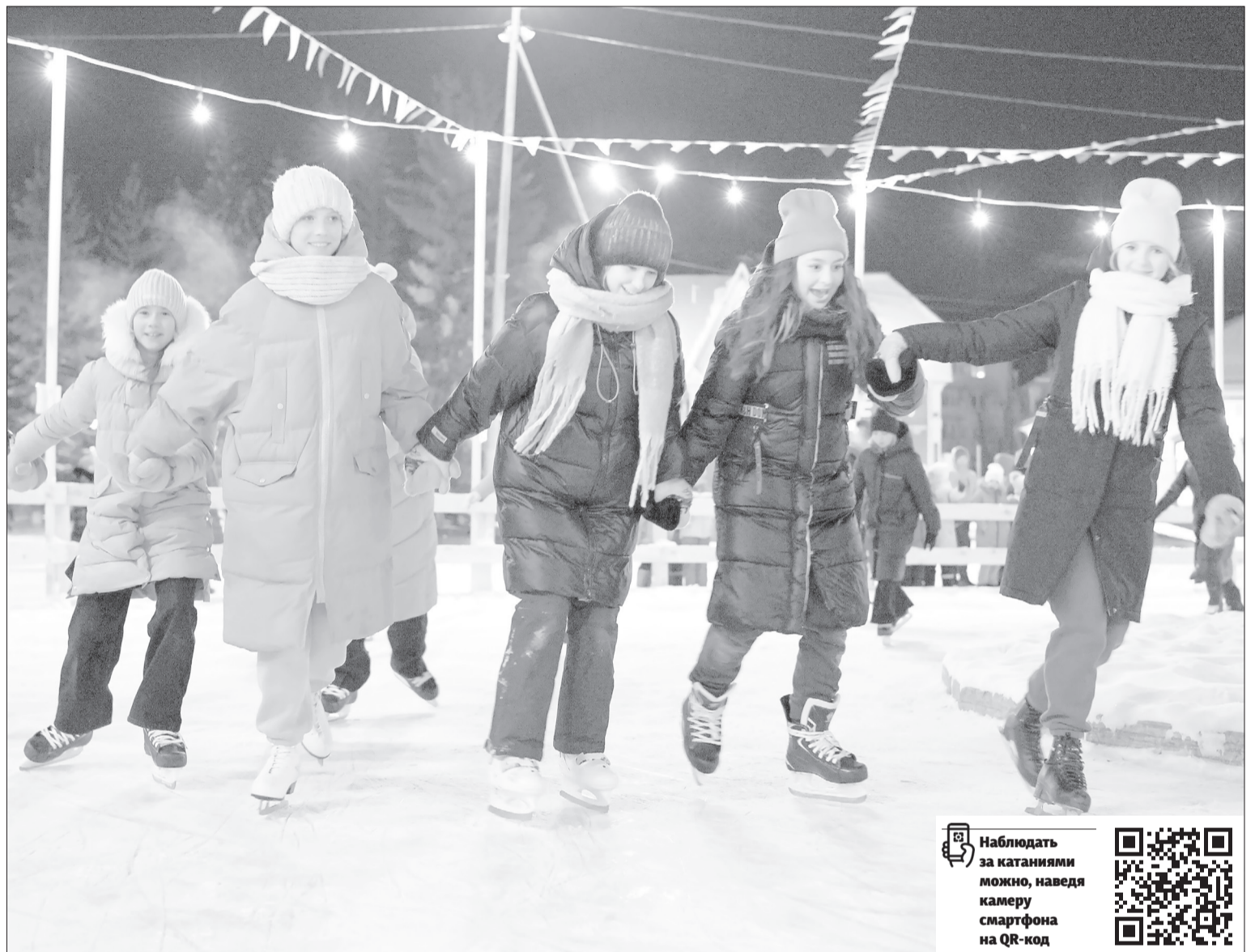
Кататься можно только по кругу против часовой стрелки

■ СПРАВКА «ЯЖ». Уход на карантин или так называемое «закрытие» школ не означает, что учебный процесс останавливается. Он продолжается дистанционно, все возможности для этого образовательные учреждения имеют.