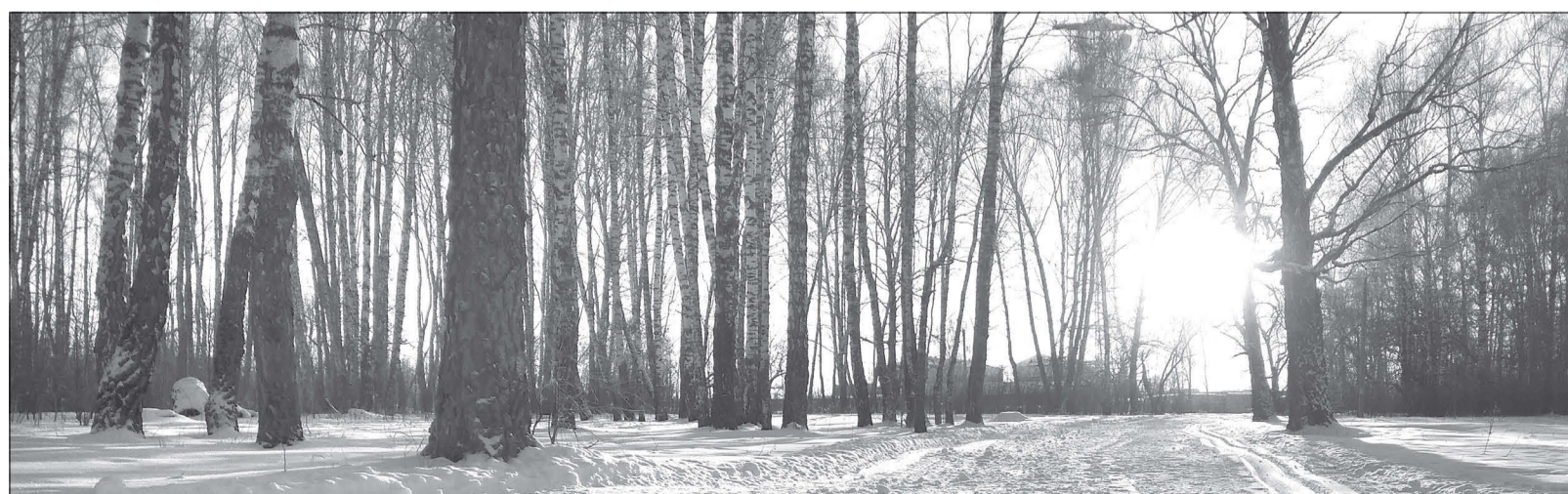
Зимняя красота Ялуторовска вдохновляет местных поэтов

Ты никогда мне не поставишь шах и мат, Мы вечные соперники с тобою. Ты - свет, я - тьма, ты - райский сад, я - ад, Ты признан Богом, я же стал изгоем. Ты в мир несёшь любовь и красоту, Улыбки, радость, честность и внимание. А я печаль и боль преподнесу, Потери и вселенское отчаянье. Ты никогда мне не поставишь шах и мат, Как ни старайся, бесполезно это. И в этом ты, мой друг, не виноват, Да и моей вины здесь тоже нету. Сорваться в пропасть, затаив обиду, Или с надеждой взмыть под небеса. Мы можем лишь смотреть на человека, Но вот свой путь он выбирает сам!