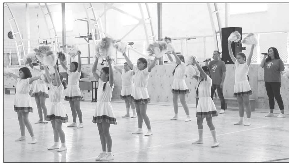
Из-за пандемии открытие беркутского спорткомплекса прошло без зрителей и пышных церемоний

Женья уверен, что компьютер необходим, так как в семье Мигуновых сразу несколько школьников