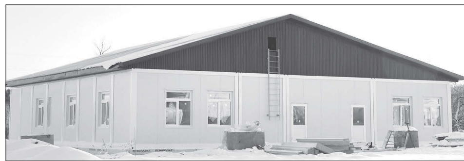
Новое здание заводопетровской школы уже возведено, подрядчик приступил к монтажу коммуникаций и отделке помещений