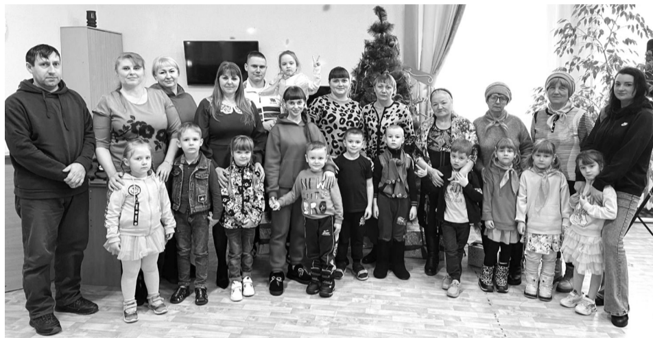
На снимках: фрагменты мероприятия