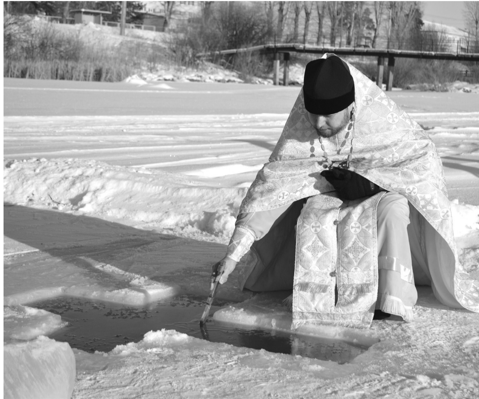
Чин великого водосвятия

Важность этого праздника для православных христиан не ограничивается только одним событием в году. Воспоминание о крещении Христа является постоянным напоминанием о собственном креще-