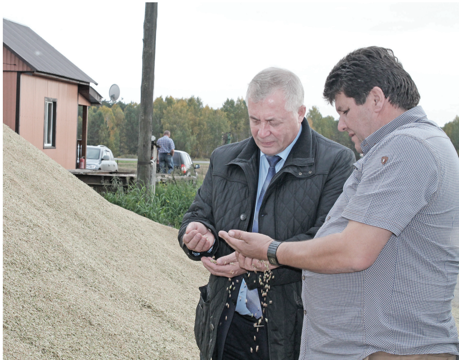
Сергей САМ. Фото автора

По площади, которая уже убрана, Нижнетавдинский район входит в первую десятку, на небольшие проценты отставая от среднеобластного показателя. Впрочем, «считать цыплят» пока рановато, так как основной объём работ ещё впереди, и дай бог крестьянам хорошей погоды, со всем остальным они справятся сами.