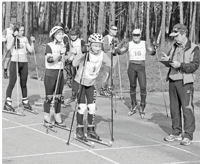
На старт! Внимание!