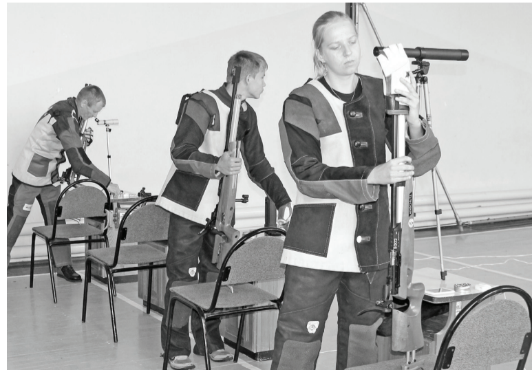
Все внимательны, собраны. Впереди стрельба из пневматической винтовки.