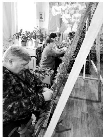
➤ В Коточиговском ДК плетут сети

Жители Викуловского района активно помогают специальной военной операции. Например, Коточиговский Дом культуры выступает организатором и пунктом сбора гуманитарной помощи, а также принимает участие в акциях патриотического воспитания молодёжи и подрастающего поколения.