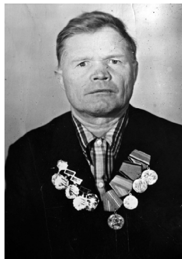
➤ Ветеран в 2001 году

Трудный и славный путь прошёл этот замечательный чело-