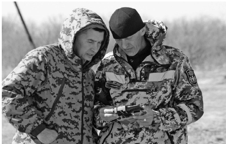
➤ Перед запуском квадрокоптера

Помимо наземного патрулирования, активно применяются средства фото- и видеонаблюдения. На вооружение работников лесного хозяйства поступили квадрокоптеры. Использование беспилотников для охраны леса – альтерна-