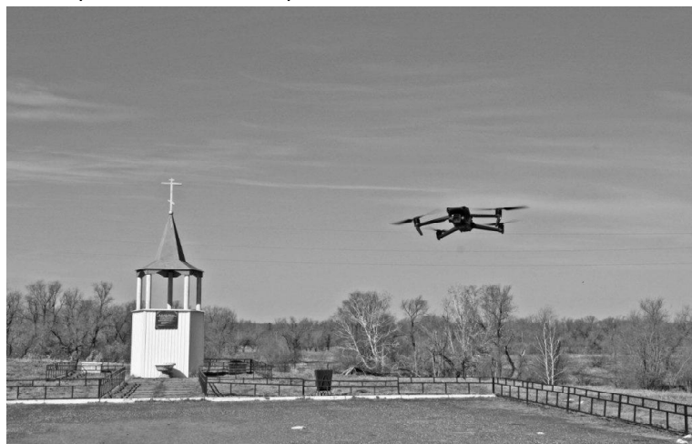
➤ Беспилотник над Шаньгиным бугром

тива классической авиационной разведке. Они позволяют оперативно проводить разведку очагов возгорания, определять своевременно направление очагов возгорания, их интенсивность, угрозу распространения и многие другие критерии. Оснащенный камерами дрон выполняет полёт и передаёт информацию оператору в режиме реального времени.