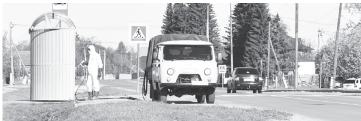
Остановочные комплексы в райцентре ежедневно обрабатывают дезинфицирующими растворами.

Для получения масок и за более подробной информацией необходимо обратиться в диспетчерскую службу центра «Забота» по телефону: 8 (34537) 211-67.