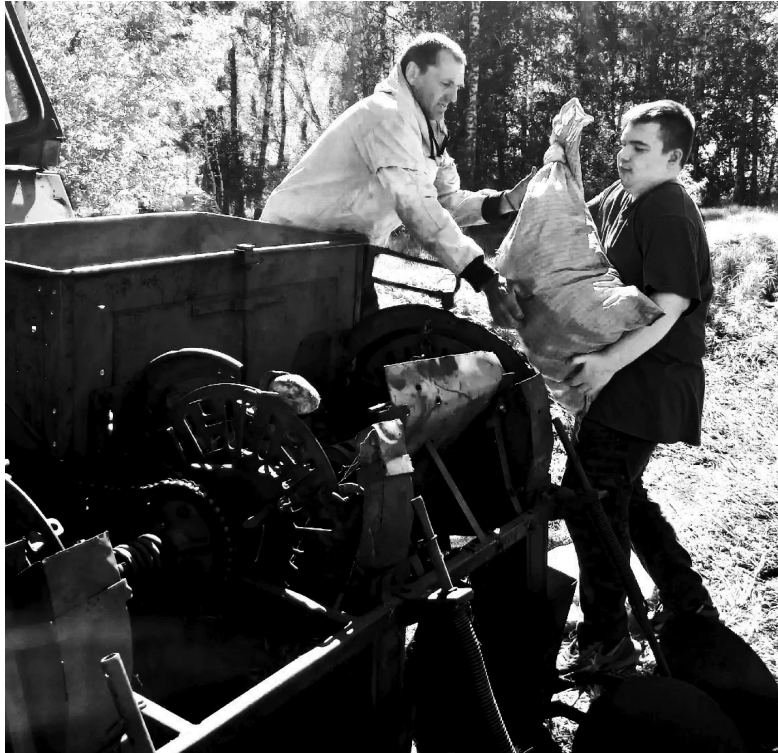
Волонтеры засыпают картофель в сеялки. Выйти на поле их объединило желание поддержать защитников Отечества, как могут

– Когда объединяются волонтеры, бизнес и местная власть – вырастает не просто картошка, а уверенность в том, что своих не бросаем. Картофель на посадку собрали жители сёл Медведово, Ражево, деревни Земляной, посёлков Гольшманово и Ламенского. Спасибо каждому, кто причастен к этому благородному делу, – поделилась руководитель благотворительного штаба «СВОих