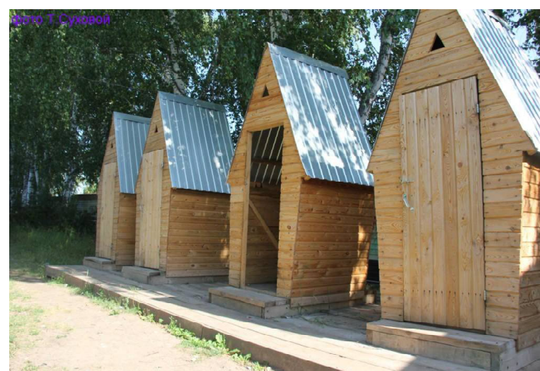
➤ У туалета теперь нет двери.