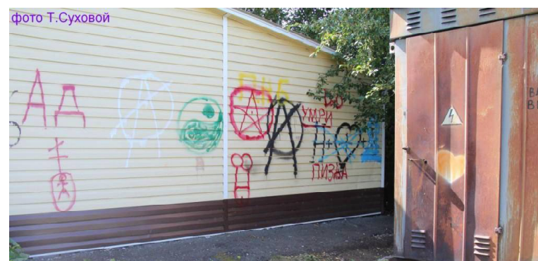
➤ «Наскальная живопись».