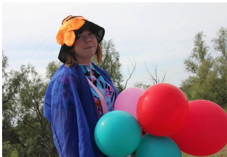
➤ Как прекрасны дни в наших «Русичах»!