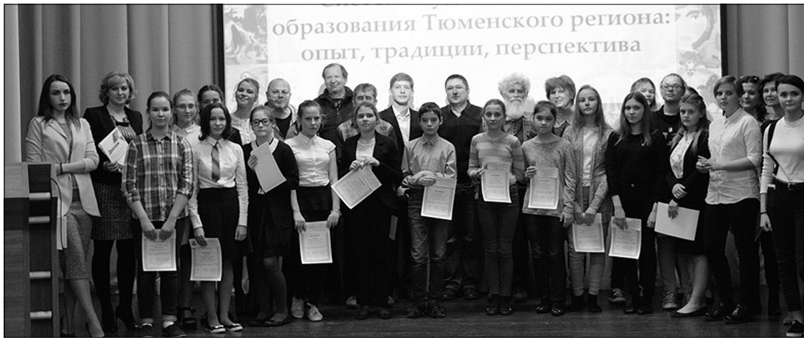
Фото ДШИ «Фантазия».