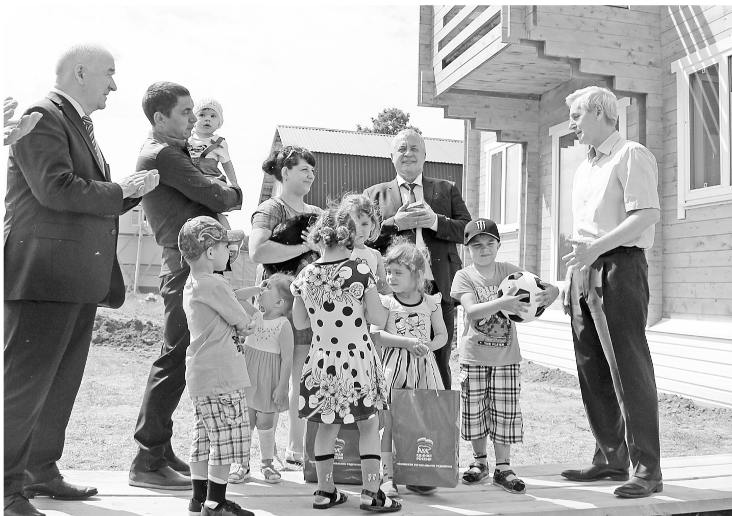
Сосчитайте малышей – их ровно семь! Счастливая семья возле нового дома в окружении тех, кто помог осуществить мечту.