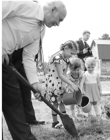
Сирень обязательно приживётся, ведь посажена возле нового дома с таким старанием и любовью.