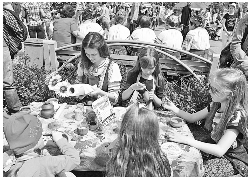
На подворье «Гончарное чудо».

Сотни и сотни тюменцев и гостей областного центра получили в этот день море положительных эмоций, хорошо отдохнули семьями, а самое главное, испытали чувство гордости за нашу дружную многонациональную страну. Здесь можно было сфотографироваться с представителями всех национальностей, вместе потанцевать, попро-