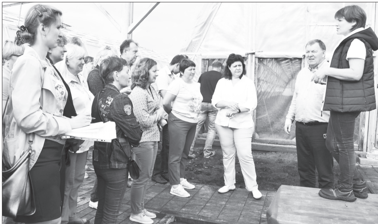
Аграрии Томской области в тепличном комплексе агрофирмы «КРиММ».

25 июля производственные площадки ООО «Агрофирма «КРиММ» посетила делегация из Томской области. Более полутора тысяч километров преодолели руководители фермерских хозяйств, директора крупных предприятий и управленцы областных структур АПК, чтобы узнать о секретах успеха аграриев Тюменской области.