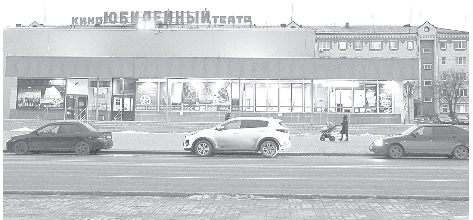
Припаркованные у кинотеатра автомобили мешают не только общественному транспорту, но и автомобилистам, поворачивающим с улицы Свердлова на улицу Ленина

Комиссия по БДД рассмотрела просьбы водителей и пешеходов