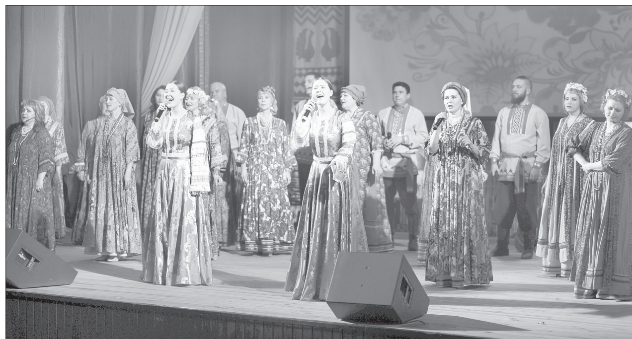
Новые микрофоны прекрасно ловят голоса солистов и всего хора

Большие планы. В хоре представлено полное многоголосье. Нет только баса. Но это вообще большая редкость, и если такой найдётся - его с радостью примут. Среди 24 вокалистов подавляющее большинство - женщины, но и мужчин тут