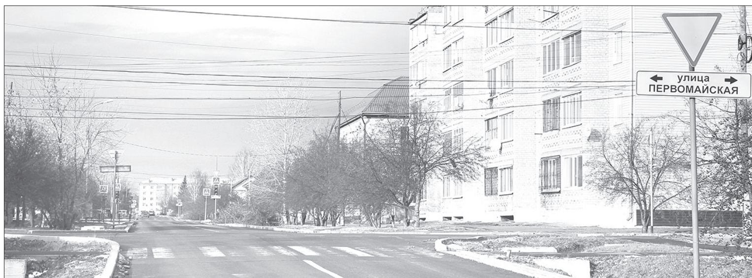
На перекрёстке улиц Якушкина и Первомайской нет ни одного знака «Пешеходный переход», виднеется лишь полустёртая зебра

Комиссия по БДД рассмотрела просьбы водителей и пешеходов