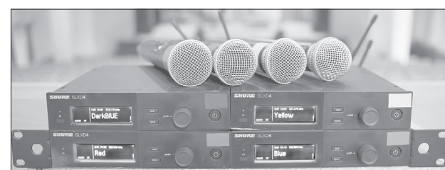
Профессиональные радиомикрофоны маркированы по цвету: синий, красный, жёлтый, голубой. Это позволяет быстро настраиваться звукооператору концерта

В период действия санитарных ограничений, конечно, не до больших концертов с аншлагами. Все с нетерпением ждут, когда ситуация стабилизируется. А пока используют возможность создания онлайн-трансляций на студийной базе МАУК «Арт-Вояж».