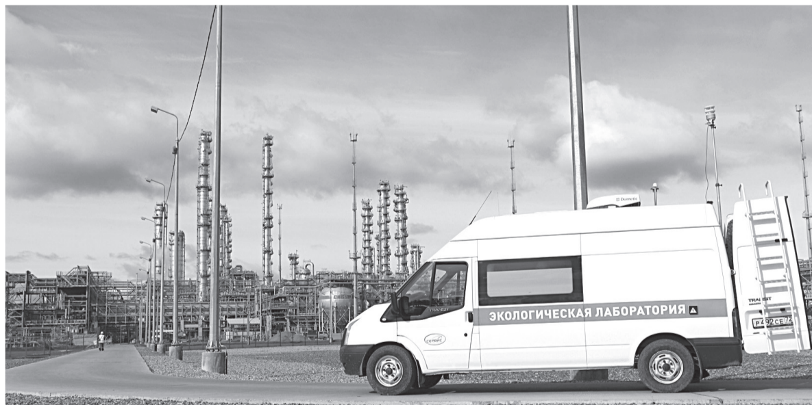
Данные экомониторинга воздуха за январь 2022 года Выполнено 2232 пробы, проведено 13392 измерения

В каждой пробе воздуха специалисты измеряют концентрацию диоксида азота, диоксида серы, оксида углерода и пыли. Это четыре наиболее распространённых загрязнителя воздуха, выделяемых в результате дея-