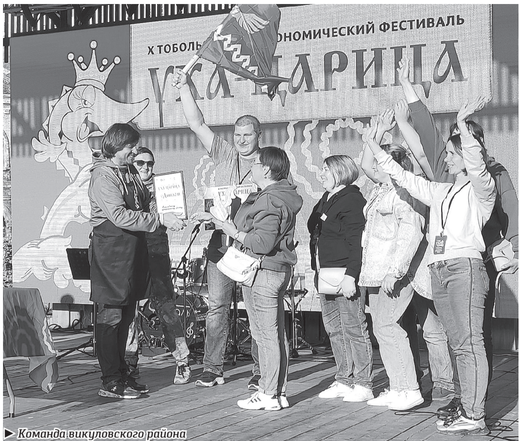
Команда викуловского района