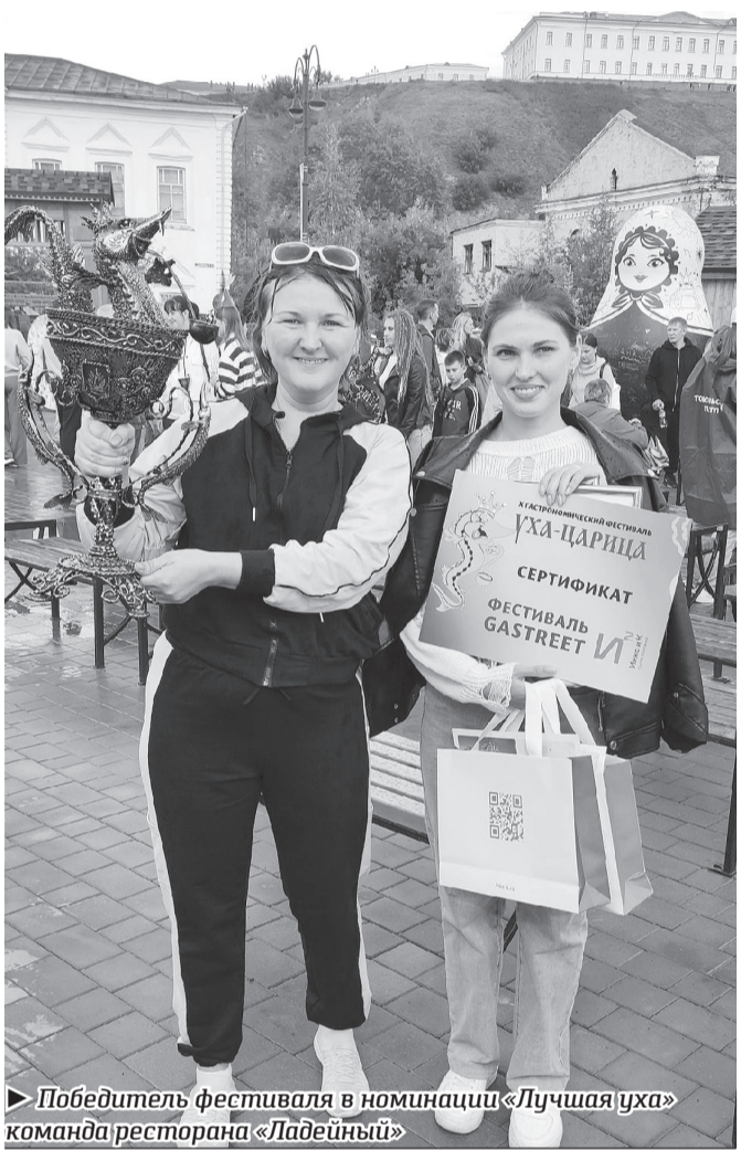
Победитель фестиваля в номинации «Лучшая уха» команда ресторана «Ладейный»

«1 Тобольск – это великий город, который славен не только тем, что здесь более 200 памятников архитектуры под открытым небом, он славен своими людьми и победами. В 2017 году Тобольск заслуженно получил почётное звание – культурная столица малых городов России! И каждый день команда управленцев вместе с жителями города доказывают этот статус, а он и в масштабных преобразованиях, и мероприятиях, и в воспитании молодого поколения. Тобольск действительно становится всё краше. Я благодарю каждого, кто вносит свою лепту в его развитие, и каждого, кто сегодня пришёл разделить с нами этот уютный домашний праздник, который объединяет нас всех ещё крепче».