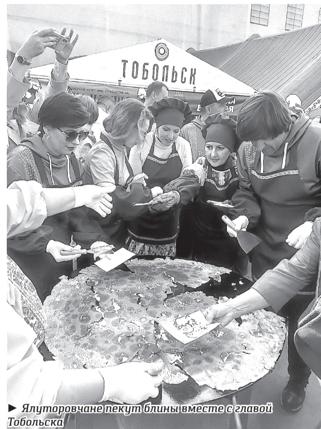
Ялтуровчане пекут блины вместе с главой Тобольска