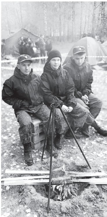
Специализированные классы подготовки к военной службе давно популярны у юргинских мальчишек