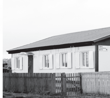
Облик села меняется, но по-прежнему его большая протяжённость создаёт определённые трудности для новотаповцев