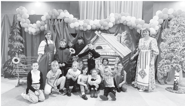
На занятиях краеведческого объединения

тельное образование» говорит за себя: любой юный житель района должен иметь возможность получить дополнительное образование, независимо от места жительства. Для этого наши педагоги выезжают в сельские поселения и занимаются с ребятами.