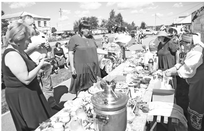
«Самовар кипит, самовар поёт, в нём вода бурлит, разговор ведёт. До чего ж хорош наш душистый чай! Веселей смотри да гостей встречай!»

Чашка этого вкусного напитка и угощения нашлись здесь каждому гостю