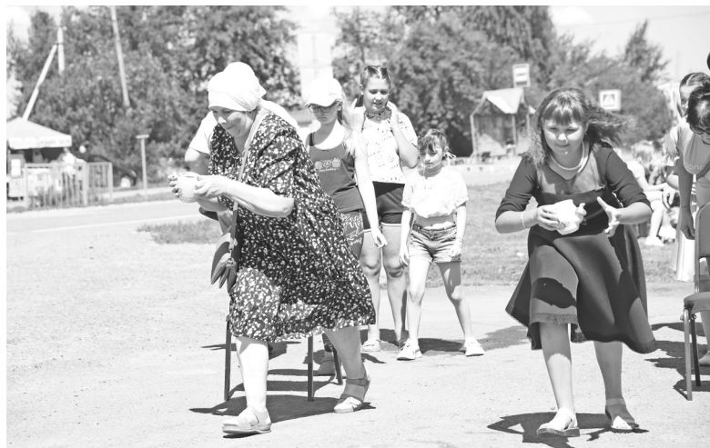
Перенести сушку на носике заварника – один из азартных конкурсов