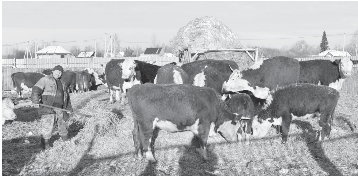
Мясное животноводство в Ярковском районе находится сегодня на подъёме

качеван я встретился с семьёй фермеров, занимавшейся разведением скота мясного направления. Поголовье в их хозяйстве составляло на тот момент 2400 голов. «А сколько человек у вас занято?», – спросил я у канадцев. Ответ меня очень удивил – с таким огромным стадом управлялись всего лишь четыре человека! При этом в совхозе, где я прежде работал директором, на меньшем поголовье скота было задействовано 500 человек!