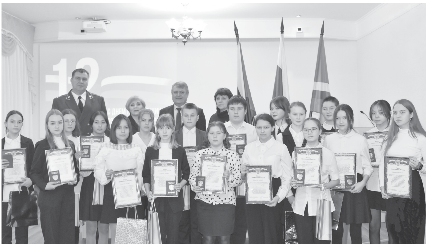
Торжественное мероприятие завершилось общим фото на память

Восемнадцать юных жителей района в торжественной обстановке получили паспорта граждан Российской Федерации. Церемония вручения главного для каждого россиянина документа состоялась в зале заседаний администрации района в День Конституции Российской Федерации 12 декабря.