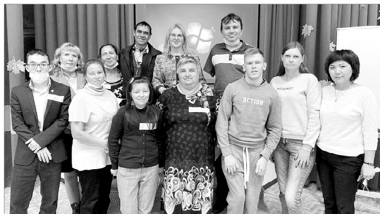
Участники проекта «Наша жизнь — в наших руках»