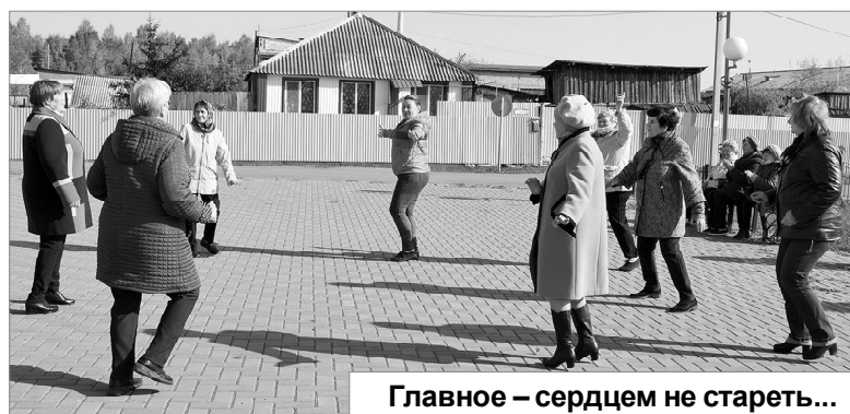
Главное — сердцем не стареть...