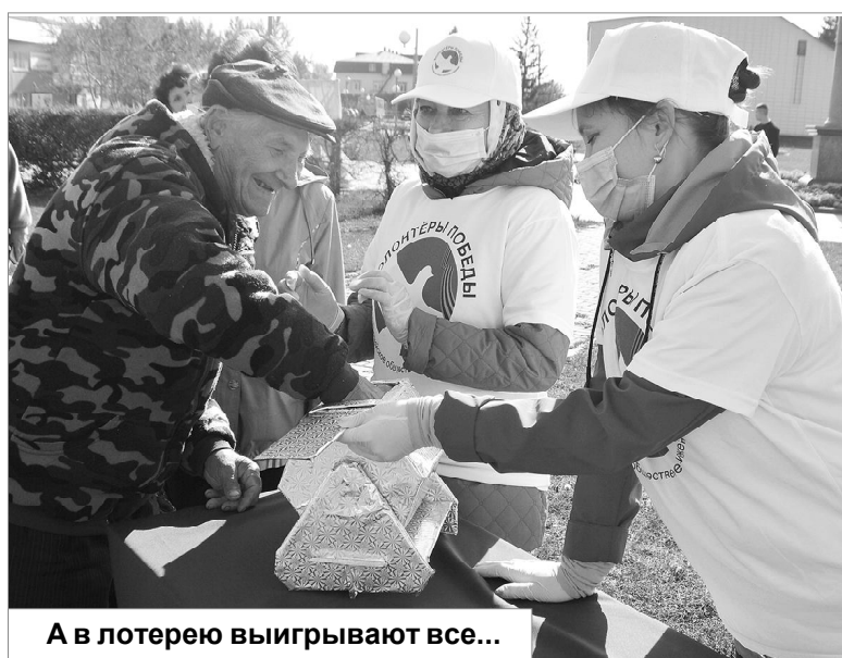
А в лотерею выигрывают все...

В связи с празднованием Международного Дня пожилых людей, сотрудники центральной районной библиотеки провели в парке «Юбилейный» акцию «Согреем ладони, откроем сердца». Они дарили открытки, изготовленные волонтерами отряда «Делаем добро и дружим», людям «золотого возраста». В это же время прошла беспроигрышная лотерея. Женщины и мужчины старшего поколения с азартом вытягивали из лототрона билетик и получали небольшие призы. Также можно было по-