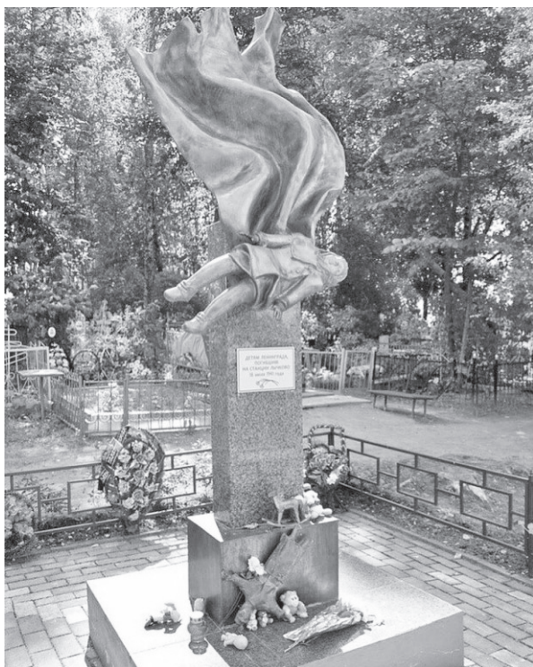
Памятник погибшим детям на станции Лычково

на узком фронте, прорвать оборону дивизии СС «Мертвая голова» и, развивая успех, овладеть Демянском. Участок фронта противника был растянут на 24 км. Деревня Лужно стояла на самой северной точке обороны.