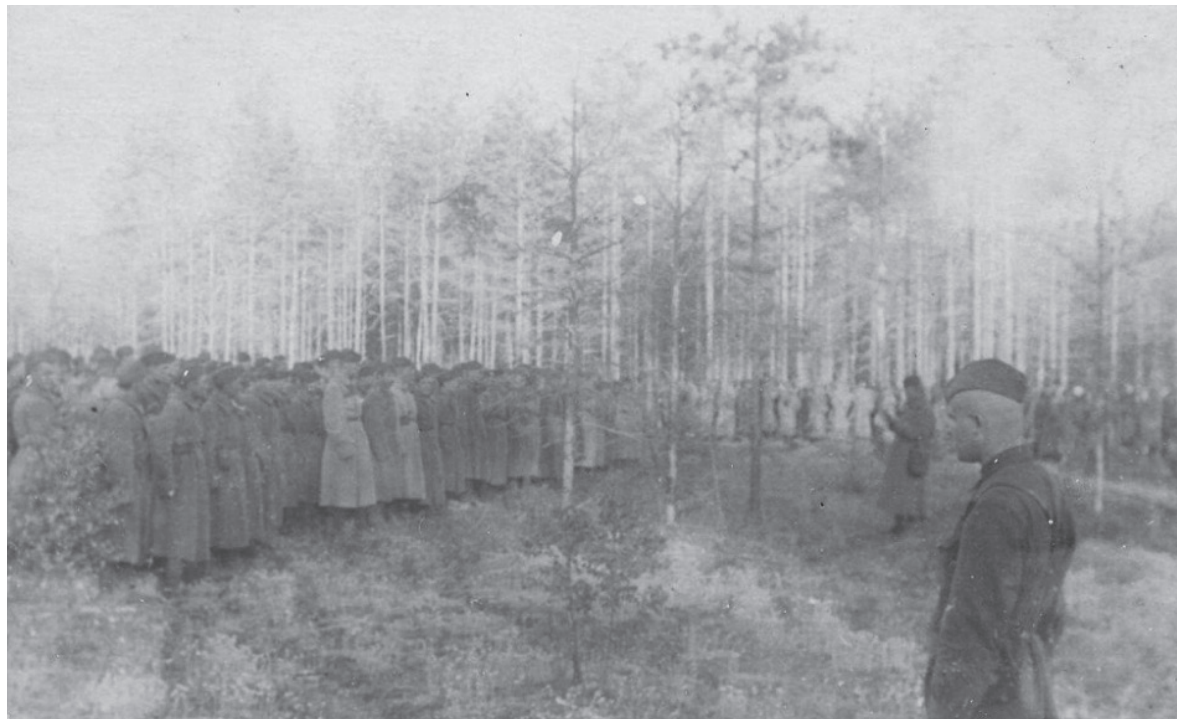
Пополнение в полках 84-й стрелковой дивизии. Северо-Западный фронт, 1942 г. Возможно, для бойцов это последнее построение. Дивизия ведет ожесточенные бои весной 1942 г. с задачей остановить любыми средствами прорыв группы Зейдлиц и перерезать Рамушевский коридор.

Фотография из личного архива Полищука Александра Михайловича — бывшего военного корреспондента газеты «За Родину» Северо-Западного фронта, затем начальника дивизионного клуба 84-й стрелковой дивизии 11 Армии СЗФ.