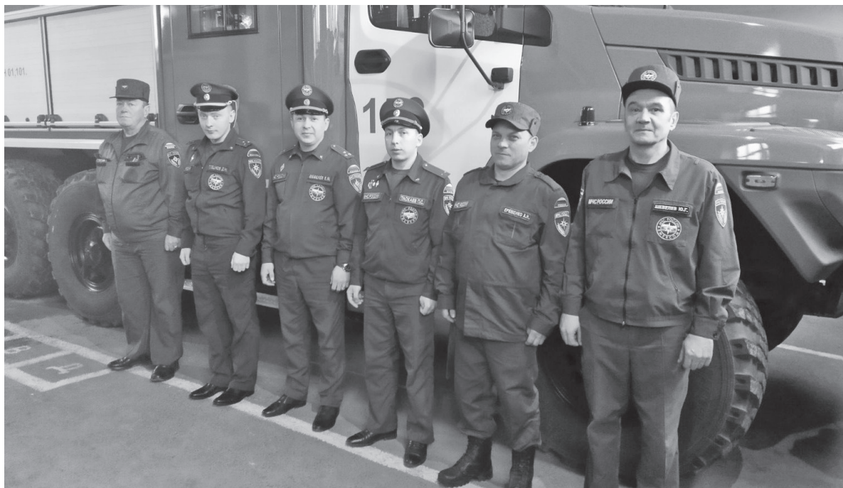
Дежурный караул пожарной части