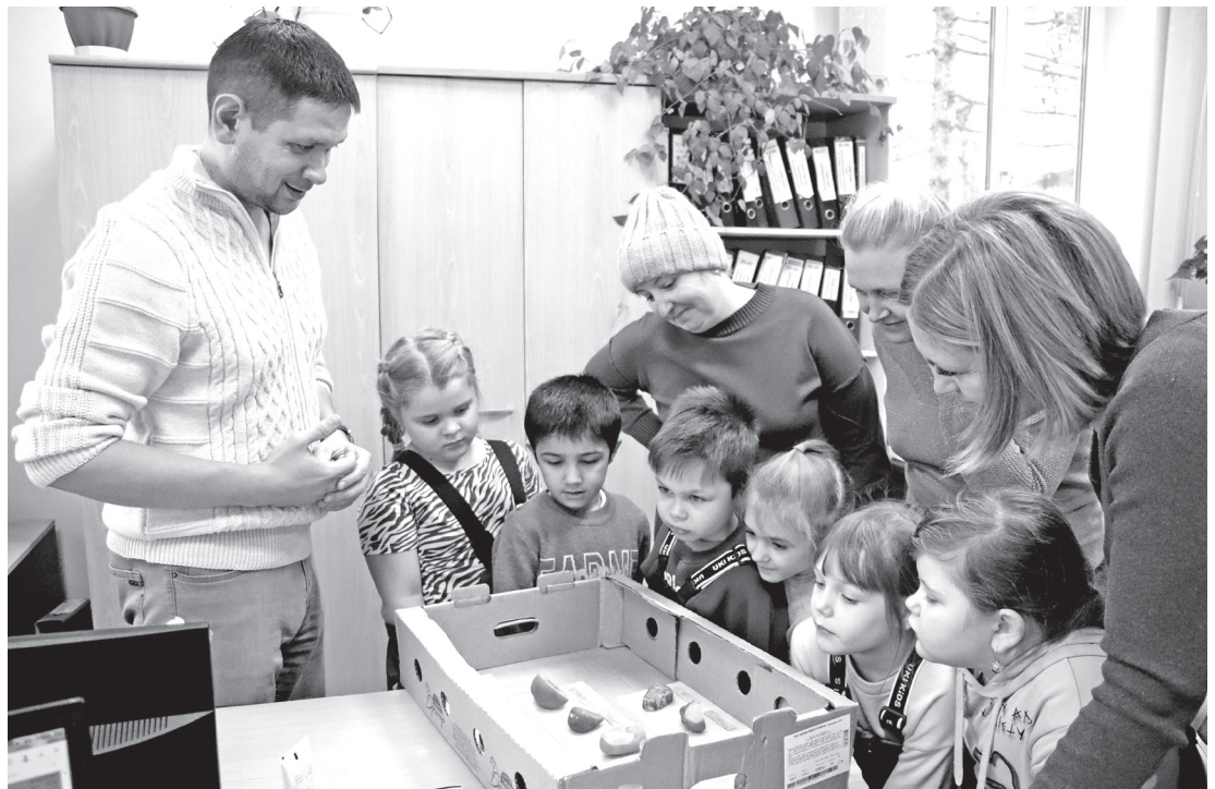
• Воспитанники городского детского сада «Светлячок» с большим интересом рассматривали муляжи картофеля, поражённого различными заболеваниями.

На днях ребята из группы «Рябинушка» городского детского сада «Светлячок» побывали на экскурсии в Заводоуковском отделе Россельхозцентра.