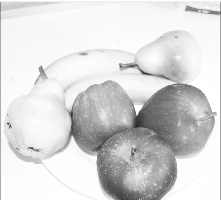
■ Больше всего клетчатки содержится в грушах, бананах, яблоках, апельсинах.