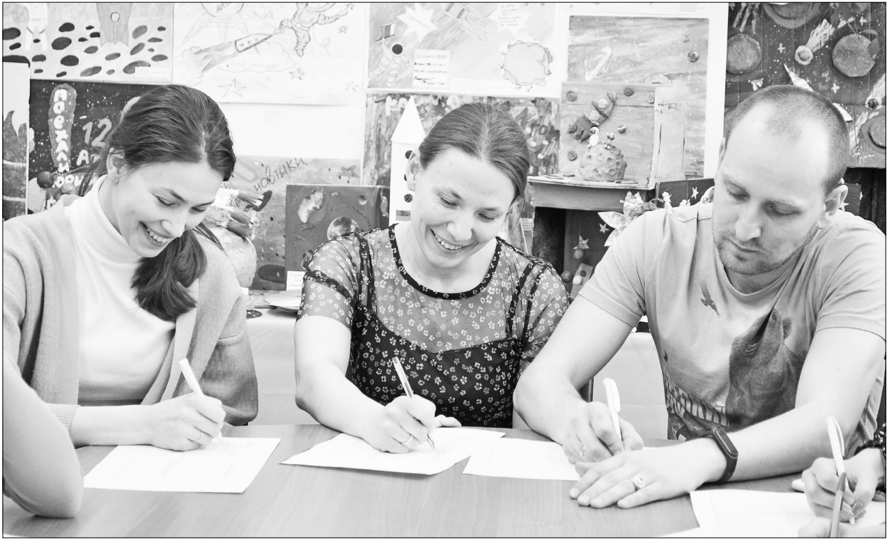
Участники «Лиги будущего» рассказывают в анкетах о своём распорядке дня и описывают свойственные им эмоции.

Нижнетавдинская молодёжь предложила пять идей для успешного будущего России