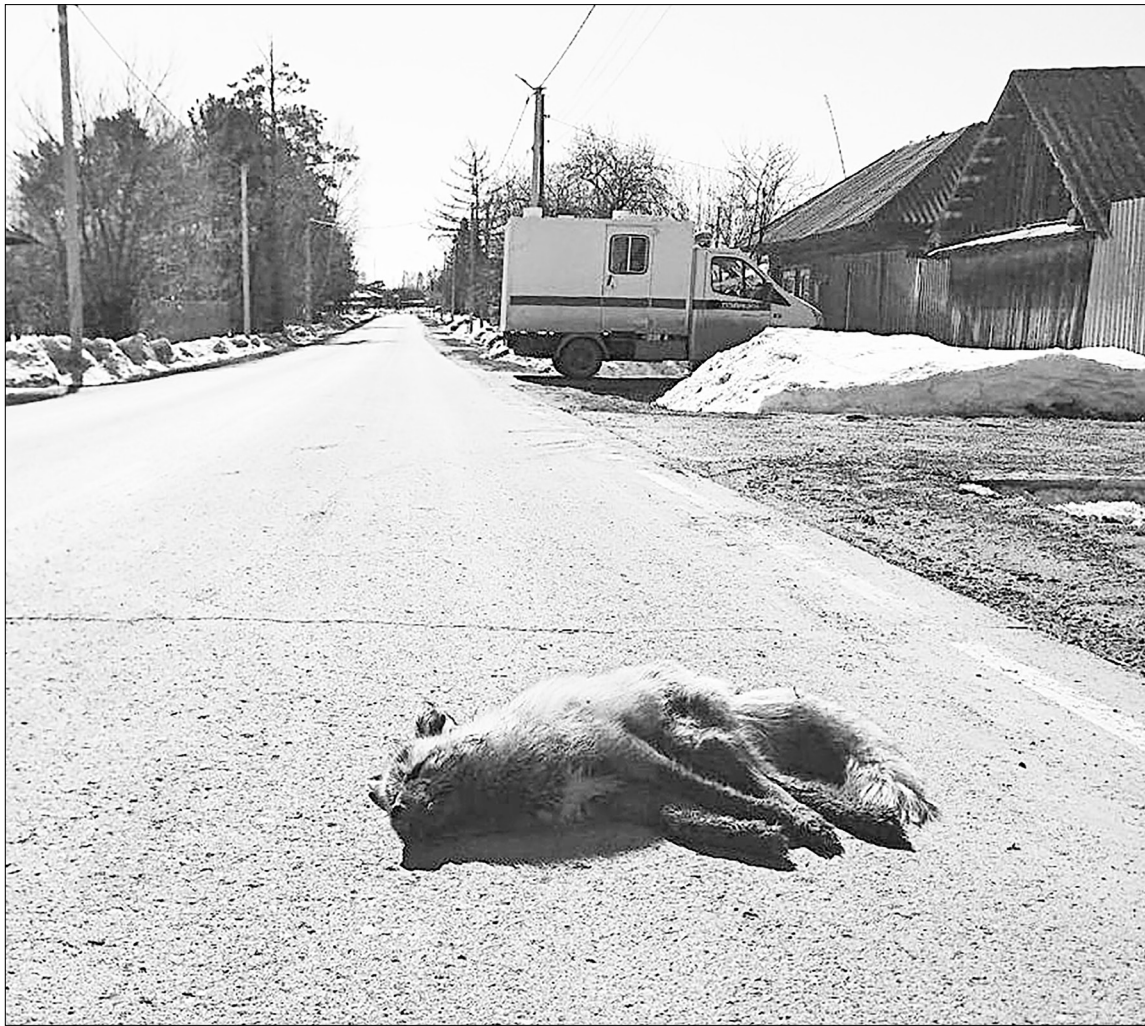
Один из эпизодов обнаружения заражённого бешенством животного на улице Тюменской в селе Нижняя Тавда.

– Первый эпизод был выявлен 25 марта в Нижней Тавде. Лиса зашла на подворье и сцепилась с собакой. В результате дикое животное погибло. Второй случай зафиксировали на ул. Тюменской, где лиса была сбита, но перед этим она достаточно долго бродила по улицам заречной части села. Все домашние животные, которые столкнулись с заражёнными гостями, незамедлительно подверглись вакцинации, так как лечение эффективно в течение 48 часов после контакта. Затем через 14 дней – ревакцинация. Третий случай произошёл в селе Троицком нашего района. Здесь болезнь обнаружена у коровы. К моменту приезда наших специалистов животное уже умерло. Были взяты биопробы, по которым и определили заболевание. После чего мы установили карантин, провели весь комплекс ветеринарно-профилактических мероприятий,