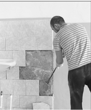
■ Работы проводит ООО «Северный Альбион». Срок окончания – ноябрь 2022.

■ Начат ремонт терапевтического отделения областной больницы № 15.