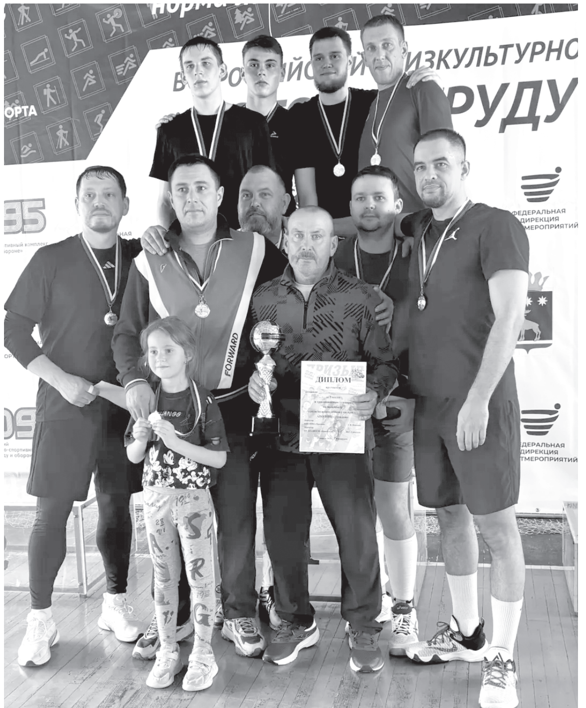
Команда-победительница. Обязательное фото на память в финале турнира

Но спорт – есть спорт, фортуна улыбается не всем, не каждый участник соревнования становится победителем. В этот раз на пьедестал почёта поднялись лесновцы. «Студенты», команда-победительница прошлого года турнира, стала второй, уступила первое место в третьей, дополни-