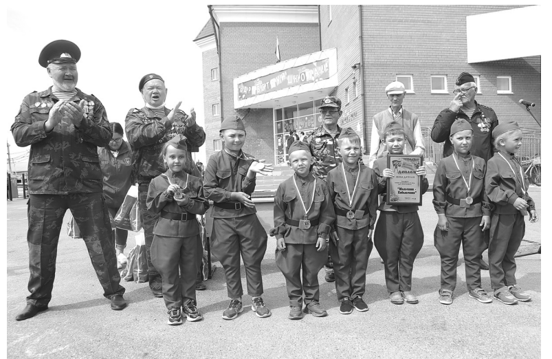
Победители – отряд «Герои Победы» детского сада «Вишенка»