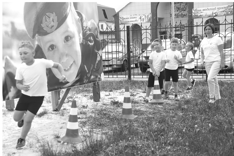
Момент состязаний, когда один за всех и все за одного

Наталья ГЛАДКОВСКАЯ