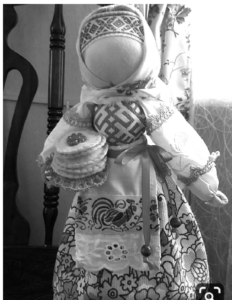
Масленичный сувенир от коллектива детского сада № 1