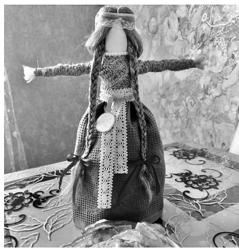
Сувенирная кукла "Масленица" Кристины Вагановой