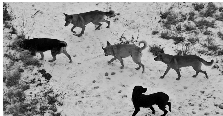
Бродячие псы сильно пугают и взрослых, и детей

Приобретая животное, мы берём на себя обязательства по