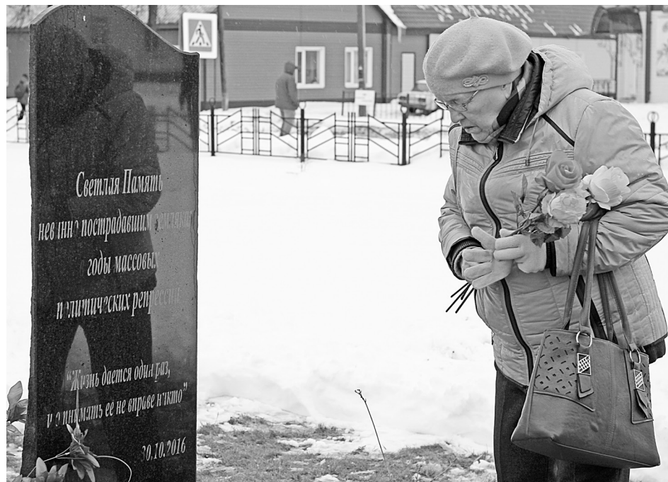
Пусть память бережно хранит воспоминания...