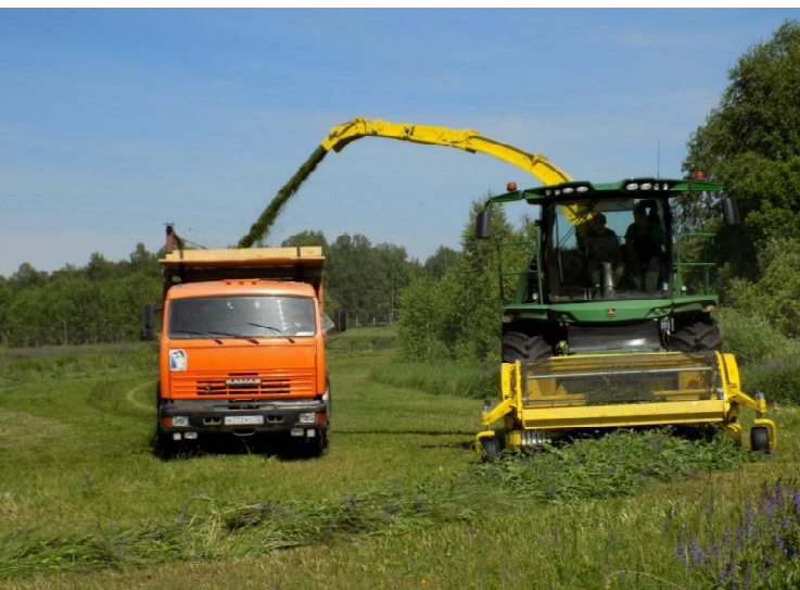
➤ Идёт выгрузка травы

Общероссийское голосование по вопросу одобрения изменений в Конституцию РФ пройдёт с 25 июня по 1 июля 2020 года.