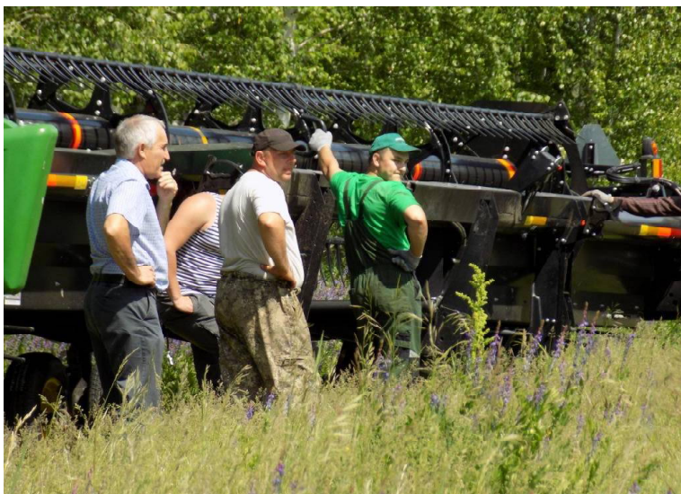
➤ Идут пусконаладочные работы

В районе стартовала кормозаготовительная кампания. Всего нужно заготовить 2 985 тонн сена и 13 700 тонн сенажа. Для этого в хозяйствах есть достаточные площади многолетних трав — 14 185 гектаров.