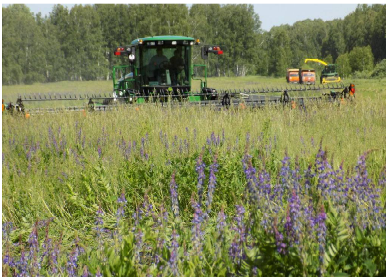
➤ На новой косилке выехали в поле

Открыло новую кампанию сельхозпредприятие ООО «Радиус-агро». Нынешний сезон запомнится этим полеводам. В первую очередь, потому что убирают травы в такие ранние сроки. Обычно эту работу начинали в июле. Сейчас — начало лета, а травостой, который нужно заготавливать в фазе плодоношения, уже полностью готов к покосу.