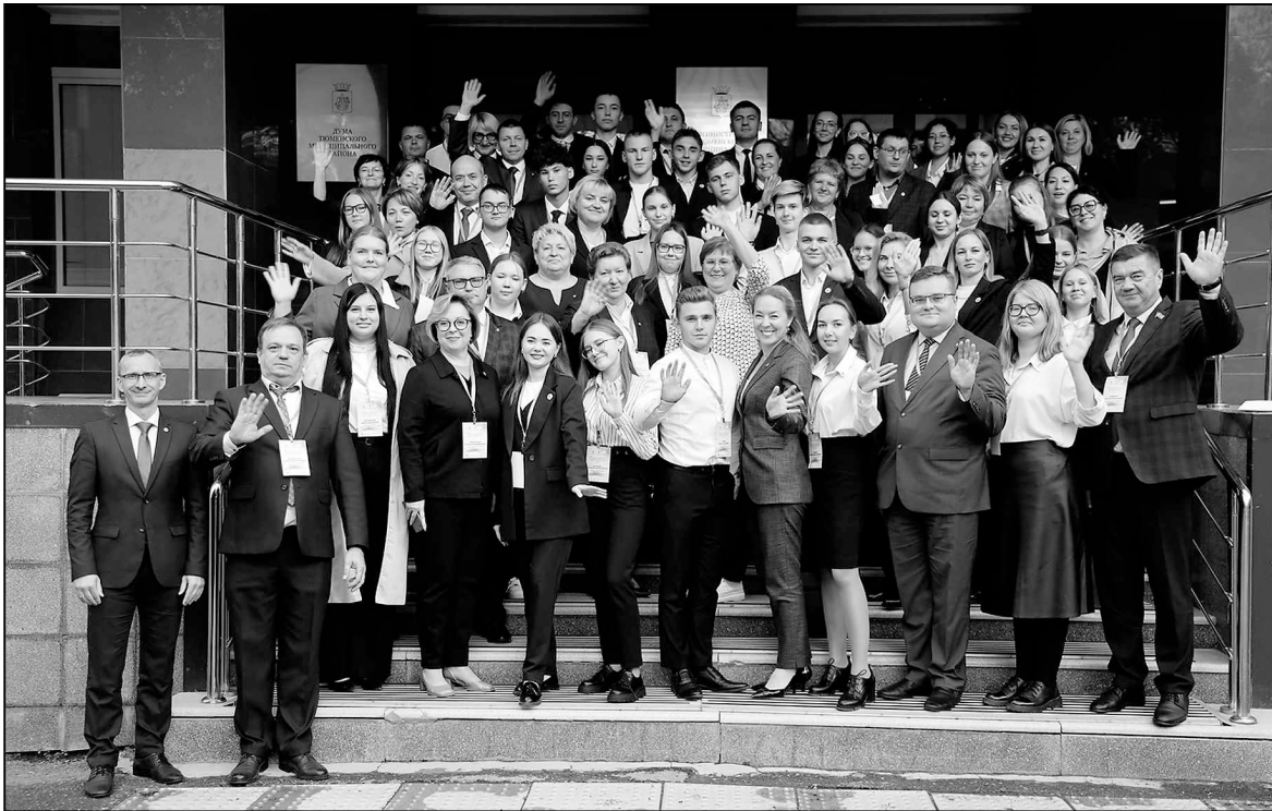
Дублеры и их наставники на крыльце администрации Тюменского района.