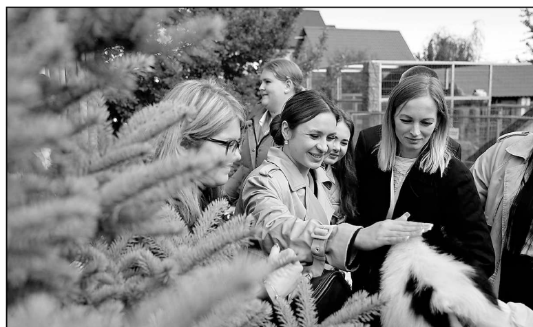
В центре реабилитации диких животных.