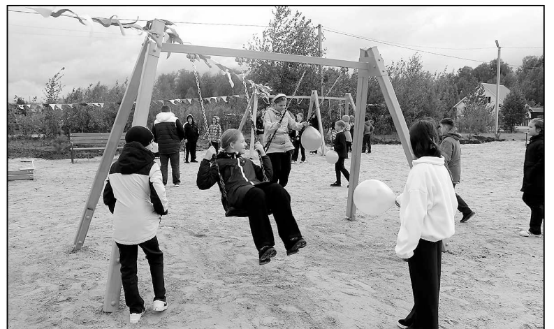
Новую площадку тут же оккупировали дети.

ировали сквер Молодежный. Но там объем финансирования был небольшой. Данный проект более значимый и по финансовому наполнению, и по масштабу. Уникален он еще и тем, что у нас это первая комбинированная площадка, на которой есть и игровое, и спортивное пространство для всех возрастов. Конечно, такой объект стал украшением не только территории новой жилой застройки