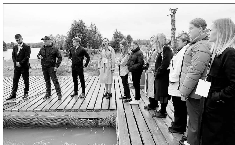
Дублеры на территории «ФишПарка».

Ольга БОРОВИКОВА.