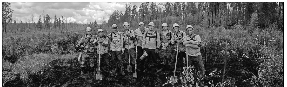
Тюменские десантники в Якутии.