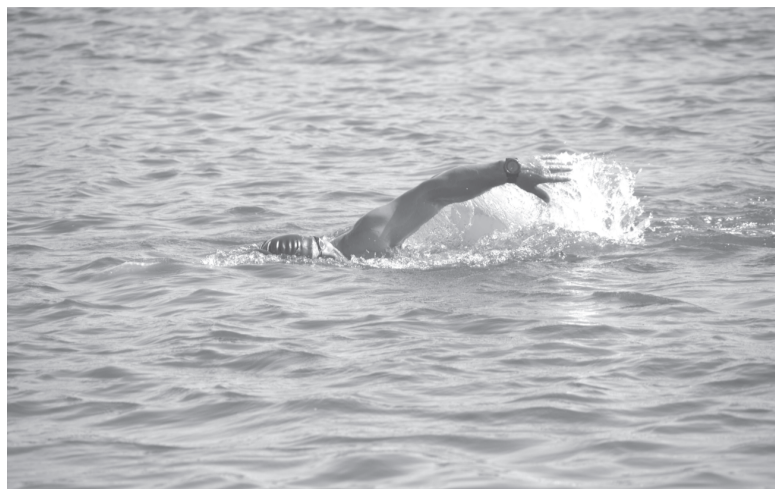
Ещё взмах до тобольского берега

Они рассказали, как замечательно приняли их в Тобольском районе: устроили на но-