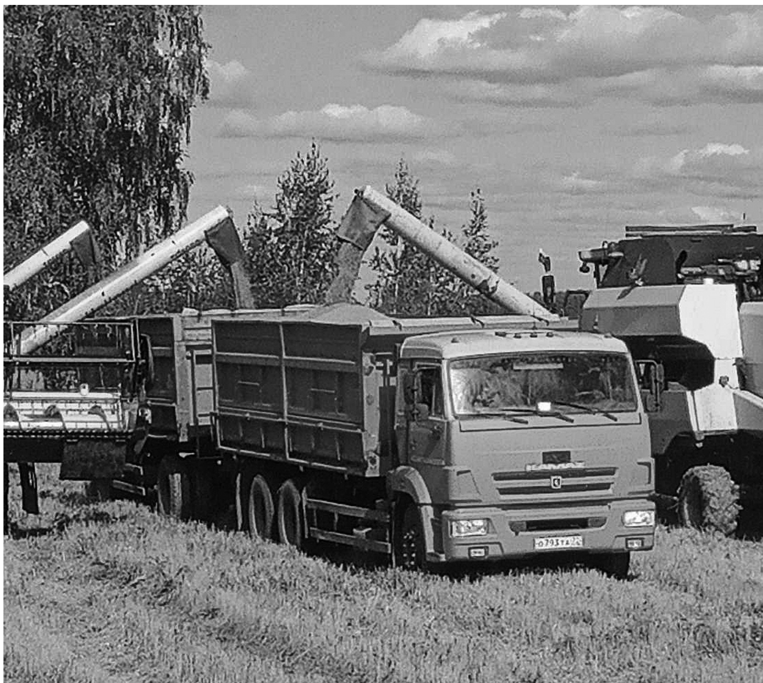
Механизаторы ловят каждую погожую минуту, чтобы успеть как можно больше