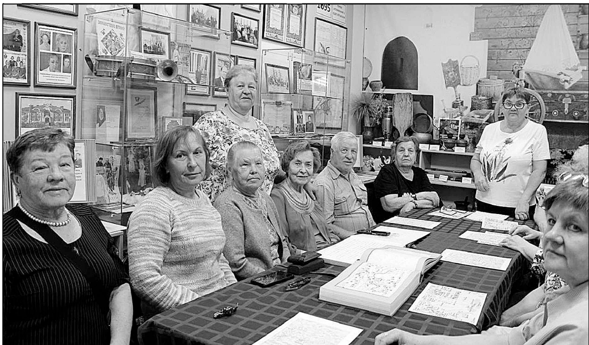
Встреча в музейной комнате.