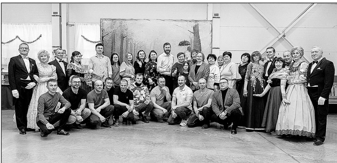
Фото коллектива «Весты» и его гостей, сделанное к 20-летию предприятия.

Инна ГОРБУНОВА.