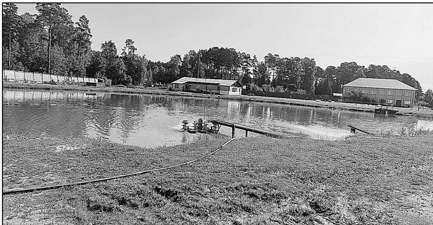
Пруд, где кишмя кишит рыба.