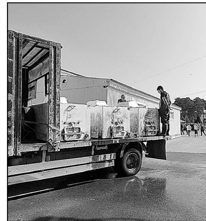
За мальками из Челябинска.