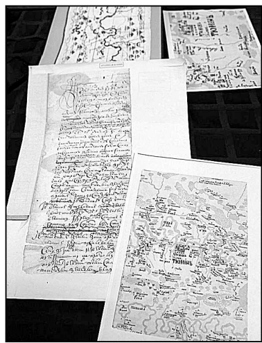
Архивные документы вызывают большой интерес.

гиной и Фуфеевой была ещё одна деревня, которая располагалась на речке Ольховка. Это Луговская деревня Перевалова. Но она исчезла! Вот о ней никогда никто из старожилов не рассказывал, хотя я сама выросла в этих краях.