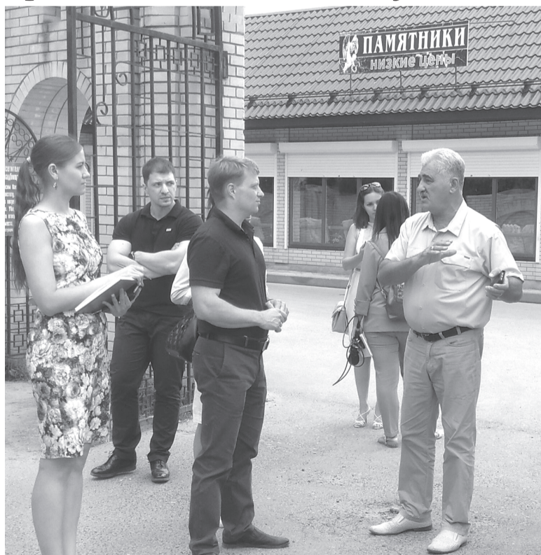
Разговор на вечную тему

бросается в глаза по пути следования жителей и гостей города