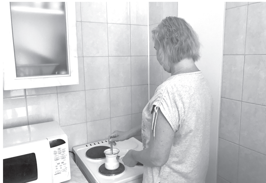
После самовольной замены газовых плит на электрические у жильцов дома № 19 «б» на ул. Ремезова вышла из строя техника

В соответствии с нормами проектирования электрических сетей удельная расчётная электрическая нагрузка электроприёмников квартир жилых домов с электрическими плитами выше удельных нагрузок квартир с газовыми плитами. В связи с чем при замене газовых плит на