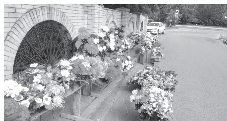
По мнению горожан, траурные украшения на тротуаре омрачают внешний облик города